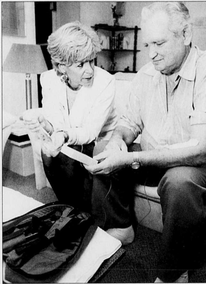
Une infirmière prodigue un traitement d'antibiothérapie au domicile d'un patient.

La Coopérative de services de l'Estrie a vu le jour en 1989. L'AVDL fut la première à lui donner son appui. Elle a même décidé d'encourager le développement d'un réseau. Ce geste de la part de l'AVDL, qui est une filiale du Mouvement Desjardins, a fait bouillir de neige, si bien que la Confédération des caisses populaires et d'économie