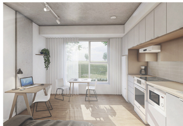
Aperçu d'un logement de La Canopée

« C'est vraiment un emplacement de choix et on en est très content. La proximité avec l'UQTR était important parce que les