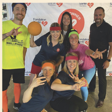
Le tournoi de ballon-chasseur aura lieu le 30 septembre prochain au CSAD.

Le Défi des générations se veut un événement panquébécois inclusif et accessible