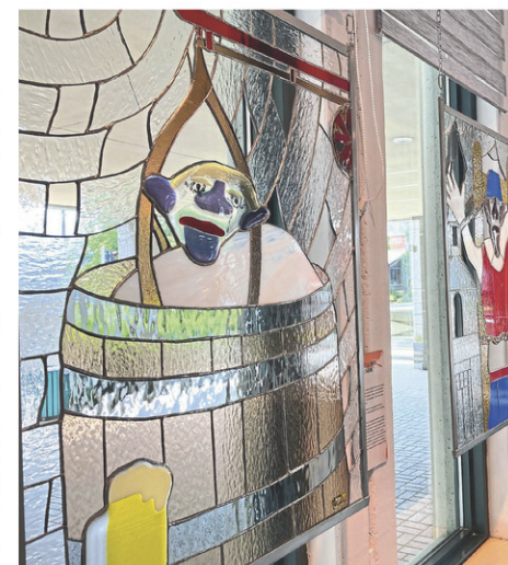
L'exposition « C'est la faute à Babine » est présentée gratuitement au Musée POP tout l'été.

« J'aime particulièrement travailler le verre pour la lumière et la couleur. J'ai aussi commencé le verre fusion il y a sept ou huit ans. Ça m'a amené à aller plus loin dans mon approche et dans mon art. Dans cette exposition, il y a justement un mélange de verre fusion et de vitrail