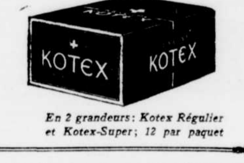
En 2 grandeurs: Kotex Régulier et Kotex-Super; 12 par paquet

Fabriqué au Canada KOTEX Serviettes Sanitaires