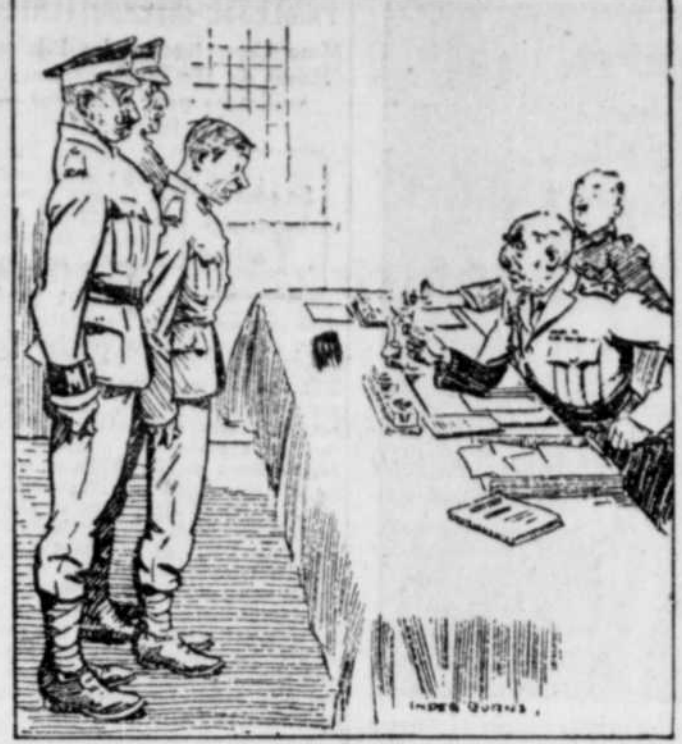
Le colonel au simple soldat assis d'avoir désiré. Qu'avez-vous à dire? Le poilu: "Les choses se sont passées comme ceci. J'étais à Waterloo quand j'ouvris la porte du wagon. Une fanfare qui se trouvait là se mit à jouer notre hymne national. Je pris la position "Attention" et quand la musique cessa le train était parti.