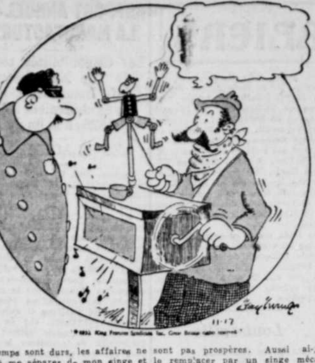
Les temps sont durs, les affaires ne sont pas prospères. Aussi ai-je dû me séparer de mon singe et le remplacer par un singe mécanique.