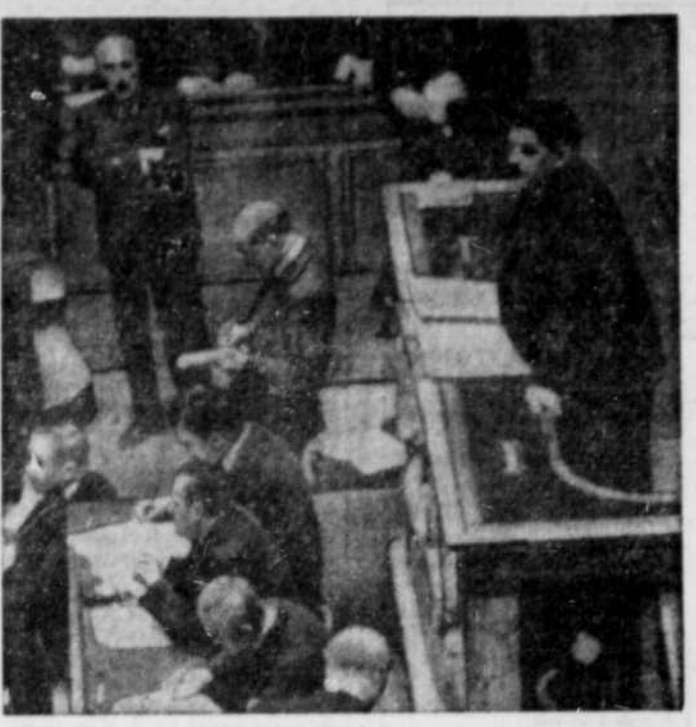
Voici la scène qui présentait la Chambre des députés français au moment où le premier ministre Herriot faisait son plaidoyer désarmant historique pour demander de payer l'indemnité américaine du 15 décembre. Ses efforts furent vains puisque la Chambre rejeta sa proposition par 402 contre 187 ce qui entraîna la chute du gouvernement.

AVIS DE VENTE Dans l'affaire de: DUBAUT & DUBAUT , Ecris Manufacturiers Les Trois-Rivières Avis est par les présentes donné LUNDI, le 20 Janvier 1933, à dix heures de l'après-midi , seront vendus par encan public, à la place d'Armes du cadant, 1563 rue Maple, les Trois-Rivières, les biens suivants: Un lot de bois dur pour meubles 26 pharmacies en chêne et noyer Sablons à courtois avec contre shaft, souffleur aspirateur de 12" souffleur no 2 avec son tuyau, un système "Devilish" pour peloteuse à l'air, avec moteur, compresseur et tous les autres accessoires, mortuaire à pied avec 8 couteaux Machine électrique pour souder les soies à ruban, 1 meule d'emery avec banc de fer, établi avec états automatiques, set de visseux pour perceuse, ainsi qu'un bon nombre de scies à ruban, scies rondes, set de couteaux, 2 jack screws, 2 extracteurs chimiques et divers autres articles en usage dans un atelier de ce genre. CONDITIONS DE VENTE: Argent comptant. Les items A et B seront vendus en bloc, et l'item C en détail, au plus haut et dernier enchérisseur. L'actif sera visible le jour de la vente ou en aucun temps en adressant au soussigné. NAPOLEON ALARIE, Syndic autorisé Bureau 176 rue Alexandre Les Trois-Rivières