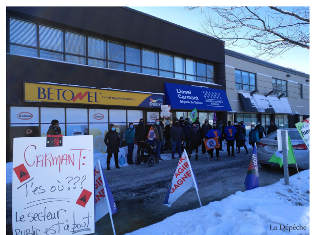
Le 26 février dernier les professeur.es du SPPCEM ont fait une course du Cégep Édouard-Montpetit jusqu'au bureau de circonscription de Lionel Carmant pour accélérer les négos.