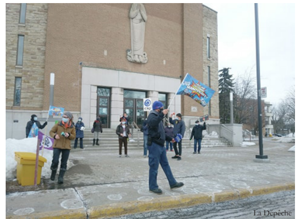
Manifestation le 9 mars pour dénoncer le recul du CPNC

La session d'automne prochain risque fort de ne pas être normale puisque nos étudiant.es ainsi que celles et ceux qui nous arriveront du secondaire auront vécu deux années scolaires bouleversées et le retour en classe ne se fera peut-être pas à 100 % à cause des mesures sanitaires. Où peut-on utiliser le petit surplus que nous avons? Et parmi ce qui est possible, où est-ce que ce sera le plus bénéfique? Nous aurons l'occasion d'en discuter au prochain Bureau syndical et en assemblée générale. On vous y attend !