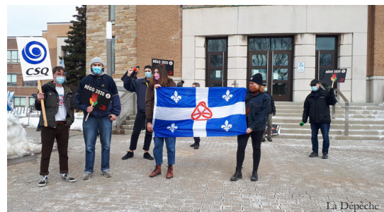
Une dizaine d'étudiants et d'employés du cégep, affiliés à la CSQ, sont venus nous appuyer