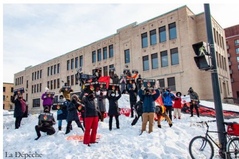
Manifestation devant les bureaux de la Fédération des cégeps

Et à ceux qui disent être trop bien dans leurs pantoufles, je répondrai qu'ils n'ont qu'à les apporter au cégep !