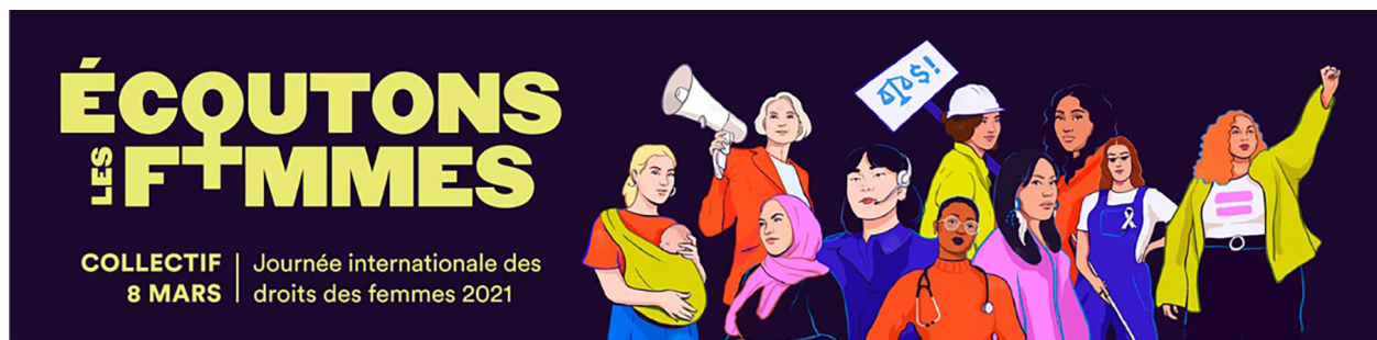
Le Collectif 8 mars. Molotov communications. Illustration : Valaska.