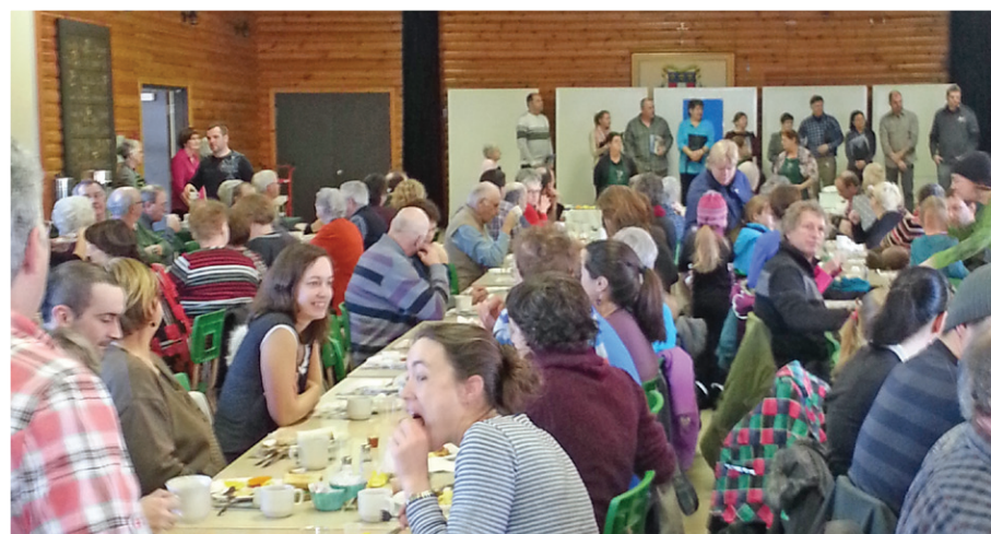
Le traditionnel brunch des Fermières du dimanche matin, où on accueille les nouveaux arrivants, a connu un très fort succès cette année encore.

De nouvelles activités étaient offertes cette année, soit les tours de traîneau à chiens, la disco sur glace et le 5 à 7 avec chansonnier du samedi soir. « Les tour