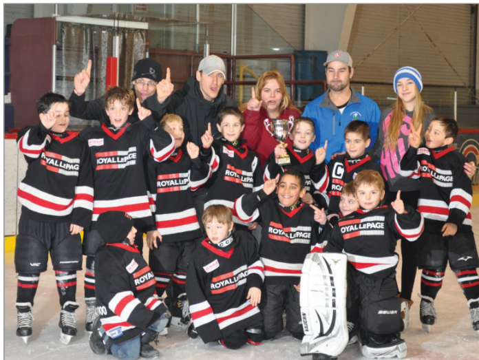
Royal Lepage de New Richmond, gagnants de la finale C.