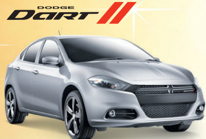
Prix de départ du modèle Dodge Dart GT 2015 montré : 24 350 $**

TAUX DE FINANCEMENT À L'ACHAT À PARTIR DE : 3,49 % ‡ JUSQU'À 96 MOIS ET AUCUN ACOMPTÉ