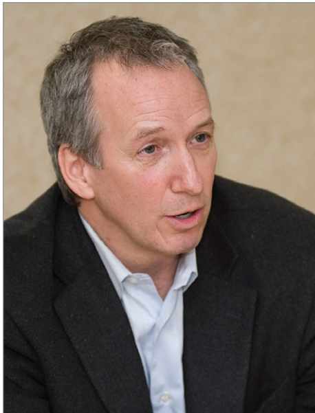
André Lamontagne amorce une tournée des régions qui l'amènera en Gaspésie afin de rencontrer les élus locaux et les citoyens.

DÉVELOPPEMENT RÉGIONAL. Le député caquiste de Johnson, André Lamontagne visitera la Gaspésie dans les prochaines semaines dans le cadre d'une tournée de consultation visant à élaborer un plan de développement économique pour les régions.