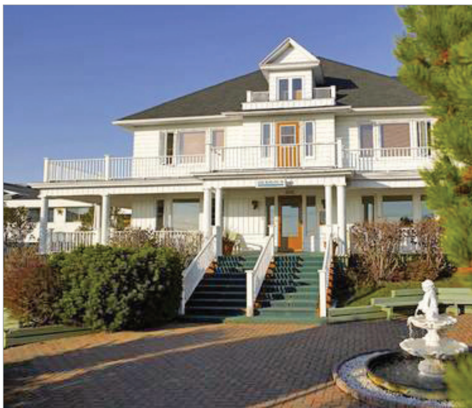
Aqua-Mer Thalassothérapie de Carleton-sur-Mer a fermé ses portes le 29 janvier.

L'entreprise a été le premier centre de thalassothérapie en Amérique du Nord, lors de son ouverture en 1985.