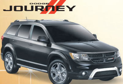
Prix de départ du modèle Dodge Journey Crossroad 2015 montré : 31 450 $**

FINANCEMENT À L'ACHAT À PARTIR DE : 97 $ † AUX DEUX SEMAINES POUR 96 MOIS FRAIS DE TRANSPORT INCLUS. TAUX DE FINANCEMENT À L'ACHAT À PARTIR DE : 3,49 % ‡ JUSQU'À 96 MOIS ET AUCUN ACOMPTÉ