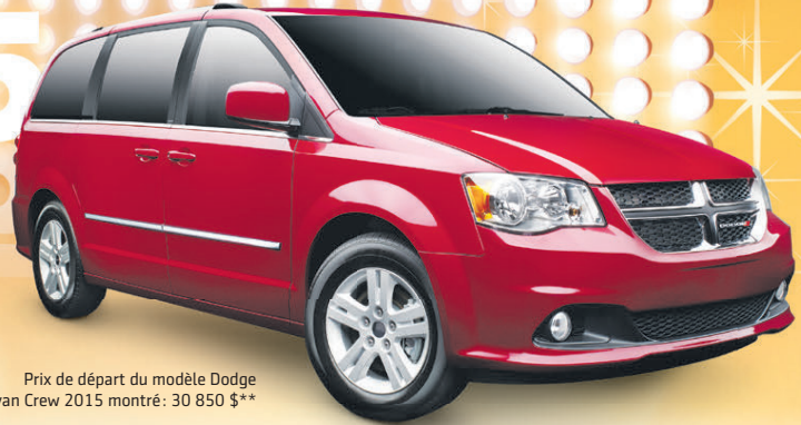
Prix de départ du modèle Dodge Grand Caravan Crew 2015 montré : 30 850 $**

PRENEZ LE VOLANT D'UNE VRAIE BONNE AFFAIRE