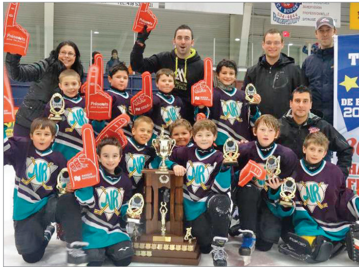
Les Aiglons de New Richmond, gagnants de la finale A.