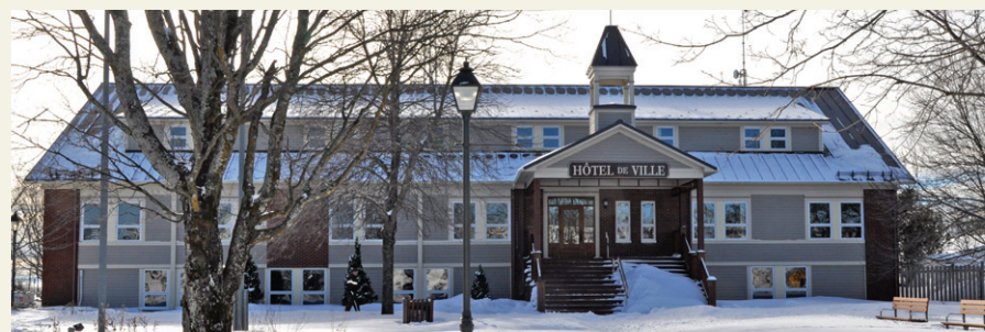
La Ville de New Richmond prépare son dossier pour rejoindre les rangs des villages-relais du Québec.

Il reste cinq à six mois à la Ville pour