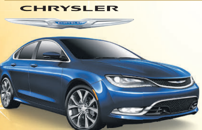
Prix de départ du modèle Chrysler 200C 2015 montré : 27 550 $**

CHRYSLER 200 LX 2015 LA BERLINE INTERMÉDIAIRE LA PLUS ABORDABLE AU PAYS †