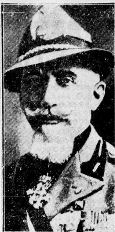
UN GENERAL. Le général Emilio de Bono, commandant en chef des forces italiennes de l'Érythrée. Il dirige les opérations italiennes sur ce front contre l'Éthiopie.

BERLIN, 11. — Les journaux locaux ne font aucun effort pour causer leurs sympathies à l'égard de l'Ethiopie dans le conflit africain. Un grand journal nazi, "Deutsches Wollen", écrit aujourd'hui: "L'Italie fasciste est en train de réaliser un programme d'impérialisme colonial. Hitler n'a pas de lauriers comme ceux que Mussolini a cueillis à Adoua. L'Allemagne n'a pas besoin de faire la guerre pour con