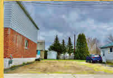
Sorel-Tracy 55 000$

Restaurant qui n'opère plus présentement, mais qui vient avec tous les équipements du restaurant. Situé sur l'autoroute 132 donc bénéficie d'une belle visibilité. Immense terrain et plusieurs places de stationnements offerts pour les clients ainsi que quelques tables de pique-nique pour manger dehors. Opportunité d'affaire à ne pas manquer!