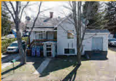
Saint-Roch-de-Richelieu 249 000$

Prestigieuse propriété construction 2006 avec vue sur le fleuve Saint-Laurent située à deux pas du site historique du Moulin à vent de Contrecoeur dans une ville en pleine expansion. Toute équipée et conviviale, cette maison à étages possède une belle luminosité, beaucoup de rangement, un garage attaché et une vaste allée asphaltée en U. Le grand terrain clôturé de 10 769 pieds carrés vous offre un énorme potentiel d'aménagement pour compléter le beau patio avec pavillon et le grand cabanon qui s'y retrouvent déjà.