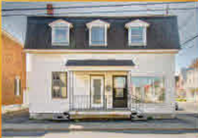
Sorel-Tracy 129 000$

Immeubles à revenus incluant deux grands logements dont un 7 1/2 et un 5 1/2. À distance de marche de tous les services dont des restaurants, transport en commun, épicerie, piste cyclable, etc. Les deux logements sont présentement occupés.