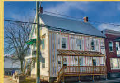
Sorel-Tracy 269 500$

Duplex de 4 1/2 entièrement loué avec entrées distinctes, deux allées indépendantes pour 2 voitures chacune, un beau terrain sans voisin direct à l'arrière et deux cabanons, dont un attaché de 12 x 21 pieds et un détaché de 8 x 8 pieds. Situé dans une ville en pleine expansion bordé par la rivière Richelieu avec beaucoup d'attraits tels qu'un traversier saisonnier et un camping abritant des jeux d'eau, des piscines et bien plus.