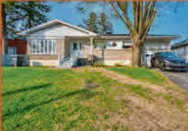
Sorel-Tracy 249 900$

Duplex composé de 4 1/2 présentement loués sans baux avec entrées indépendantes, balcons et cour intime. Parfaitement situé dans une rue tranquille, mais à 1 coin de rue de tous les magasins, épiceries, restaurants, grands parcs et autres services. Secteur recherché. Idéal pour tout type d'investisseur, bigénérationnel ou propriétaire occupant!