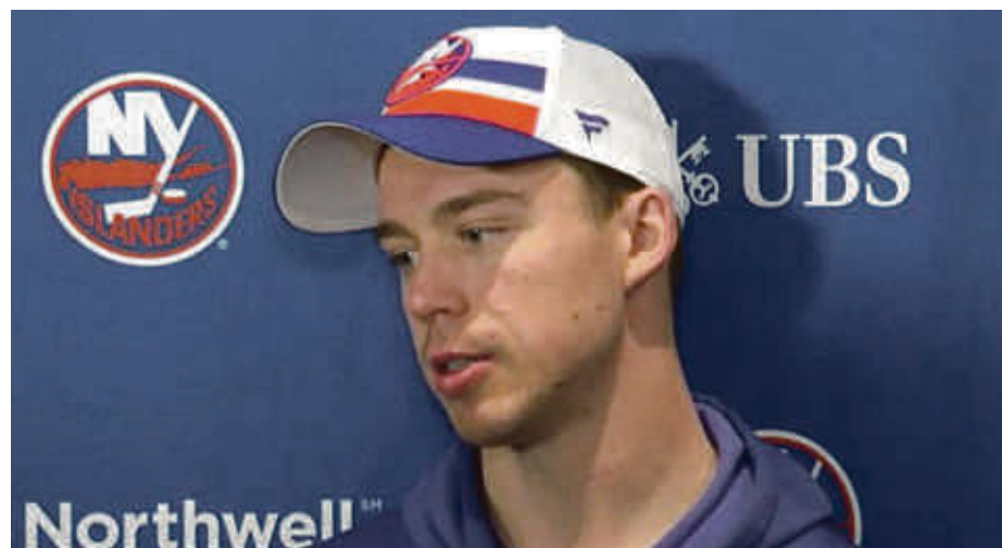
Anthony Beauvillier est déçu de la saison des Islanders, mais il compte s'entraîner fort cet été pour rebondir en 2022-2023.

Sans vouloir trouver d'excuses, Beauvillier admet que la saison a été difficile à plusieurs niveaux. « C'est décevant, on n'a pas su répondre aux attentes. On a fait face à beaucoup d'adversité cette année. On a commencé nos 13 premiers matchs sur la route étant donné que notre aréna n'était pas prêt. On a été deux semaines à jouer avec