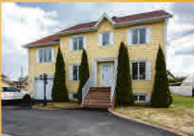
Contrecoeur 599 000$

Quadruplex très propre, bien entretenu et loué en totalité. Composé de 4 1/2 ayant tous 2 espaces de stationnements, un balcon, un espace de rangement intérieur et extérieur, une corde à linge et un grand hall d'entrée commun. Plusieurs rénovations ont été apportées. Situé tout près de l'autoroute 30 et en diagonale d'un grand parc aménagé dans un quartier tranquille. Opportunité en OR, de en main, revenu annuel favorable, très recherché!