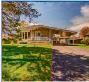
Occupation rapide. 5042, Terrasse Duvernay