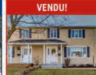
Superbe propriété, garage double, terrain de 18 000 pic ca, piscine creusée chauffée. Sublime! Centris 16939526