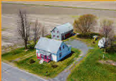
Saint-David 199 000$

Projet rénovation! Travaux de fondations effectués en 2019. L'ancien vendeur a fait lever la propriété et la fait poser sur une nouvelle fondation. Il a aussi remplacé la solive de rive. Les logements sont à refaire, car ils ont été entièrement démolis. Idéal pour en créer la propriété de vos rêves!