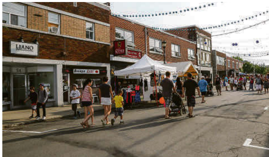
Le plan d'action pour le centre-ville est prêt, il ne reste plus qu'à savoir quand le ministère se déplacera pour faire l'annonce.

Ce dernier a répondu que le ministère viendrait faire l'annonce quand il aurait