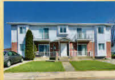
Sorel-Tracy 599 000$

Terrain sans voisin à l'arrière, prêt à construire. Bienvenue en la charmante ville historique de Saint-Ours! Elle possède un parc fédéral (Lieu historique national du Canal-de-Saint-Ours) et plus encore à découvrir. Plus de 22 000 pieds carrés en campagne à 10 min. de l'autoroute 30. 2 terrains de golf et une marina à proximité. À découvrir absolument.