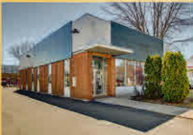
Contrecoeur 751 500$ + TPS/TVQ