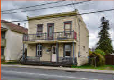
Sorel-Tracy 120 000$

Belle demeure comprenant 5 chambres à coucher et 2 salles de bain sises à deux pas de l'école Martel. Plusieurs rénovations ont été apportées depuis plusieurs années. Profitez de la cour intime clôturée munie d'arbres matures. Idéale pour y établir votre famille ou pour la fonder.