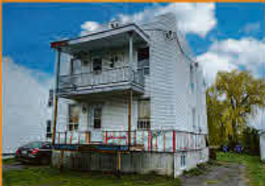
Yamaska 89 000$

Terrain vacant de 2123 pieds carrés, idéal pour bâtir un projet résidentiel. Près de tous les services essentiels et du centre-ville de Sorel-Tracy. Dans un secteur desservi par l'aqueduc et les égouts de la municipalité. À voir absolument!