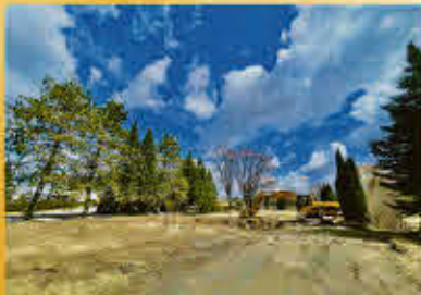
Saint-Ours 169 000$

Superbe bâtisse commerciale, hyper bien entretenue, beaucoup d'espaces de stationnement. Éclairage extérieur et enseigne à la rue, système de chauffage et de climatisation récent de qualité supérieure. Positionné sur une route passante. Branchement ou raccordement électrique sous terrain. Bonne opportunité d'affaires pour tout type d'entreprise voulant une belle visibilité, désirant s'investir et s'implanter dans une ville en pleine effervescence.