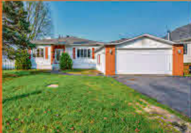
Sainte-Anne-de-Sorel 299 000$

Secteur respectable près des écoles, magasins, restaurants et de l'hôpital. Plain-pied, beaucoup de rangement avec un garage attaché, propriété présentement louée. Quartier tranquille à deux coins de rues de tous les services. Terrain de 5379 pieds carrés, entièrement clôturé. À voir!