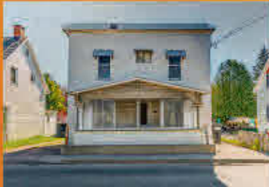
Pierreville 59 900$

Grande propriété, appartement de 5 1/2 au second plancher, 2 longs balcons, immense terrain de 1,36 arpent adossé à un boisé et à la piste cyclable de la Saunagine, aucun voisin à l'arrière, zone boisée générant ainsi la tranquillité recherchée. Immeuble en retrait à près de 150 pieds de la route minimisant le bruit de la route. Splendide véranda 4 saisons. Garage double attaché de 24 x 32 pieds. Le propriétaire actuel occupe le BDC et le locataire du haut est loué sans bail, donc une belle latitude pour le propriétaire suivant. Coin de paradis, site enchanteur, avec revenu supplémentaire et encore beaucoup plus.