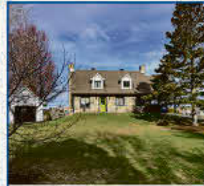
Cottage style canadien sur la rivière. 1936, chemin des Patriotes.