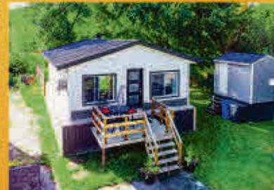
Sainte-Anne-de-Sorel 169 000$

Potentiel incroyable! Magnifique maison de campagne rustique avec multiples possibilités pour la convertir à votre goût. Sur un immense terrain de presque 1 arpent avec aucun voisin aux alentours qui bénéficie d'une vue panoramique sur les champs, une tranquillité imperturbable et une possibilité d'accueillir plusieurs animaux. Des améliorations ont déjà été débutées dont le revêtement de la toiture en tôle en 2016 et le rajout de plusieurs pièces. Elle est aussi munie d'un grand garage de type grange de 20 x 40 pieds. Merveilleuse opportunité pour campagnard et bricoleur, ne manquez pas votre chance!