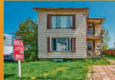
Sorel-Tracy 149 900$

Maison à étage centenaire moins chère qu'un loyer au cœur de Pierreville tout près du bord de l'eau de la rivière Saint-François et de plusieurs commodités. Cachet rétro, garage double de 20 x 48 pieds et 3 chambres à coucher. À 20 minutes de Trois-Rivières, 30 minutes de Sorel-Tracy et 35 min de Drummondville. Parfait pour personne manuelle!