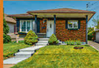
Saint-Joseph-de-Sorel 259 000$

Jolie maison située dans un secteur très paisible et recherché avec vue sur le fleuve Saint-Laurent, tout près d'une marina et de l'hôpital. Grand terrain de 9351 pieds carrés avec cour entièrement clôturée, arbre mature, garage double attaché et allée double asphaltée. Terrain vacant au côté. Opportunité rare, ne manquez pas votre chance!