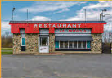
Yamaska 400 000$ + TPS/TVQ

Duplex centenaire composé d'un 3 1/2 et d'un 5 1/2. Situé à proximité de tous les services à pied, de l'hôpital, des parcs et du traversier. Prêt à être personnalisé. Beaucoup de potentiel, à petit prix!