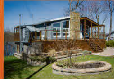
Saint-Ours 389 000$

Magnifique maison à étages moderne avec garage attaché dans un quartier familial recherché. Aménagement de qualité, 4 chambres à coucher, beaucoup de rangement, matériaux de qualité, allée asphaltée double pouvant accueillir 4 voitures et joli terrain intime et clôturé. La demeure parfaite pour abriter votre famille en tout confort à moins de 10 minutes du Mont Saint-Hilaire. Ne manquez pas votre chance!