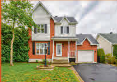
Otterburn Park 599 000$

Ce duplex possède une valeur patrimoniale supérieure reposant sur l'authenticité de son architecture et sa position. Tous les éléments architecturaux sont demeurés en bois d'où l'on peut lier le bâtiment au style Boomtown. La propriété comprend deux 4 1/2 et à proximité de tous les services. Offre une belle opportunité d'investissement. À voir!