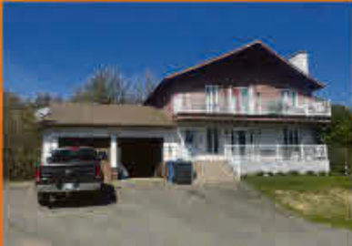
Saint-Robert 499 900$

Magnifique petite maison avec chalet d'invité sur terrain loué avec accès au Chenal du Doré. Rénovée au goût du jour en 2020, elle est idéale pour créer des souvenirs mémorables. Petite cour avec cabanon dans un secteur très paisible pour tranquillité absolue. À voir absolument, coup de cœur assuré!