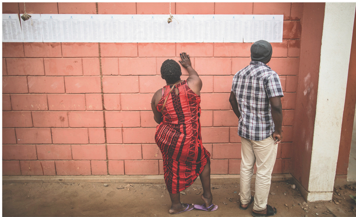
Deux électeurs dans le quartier de Bairro Popular, dans la capitale Luanda, mercredi