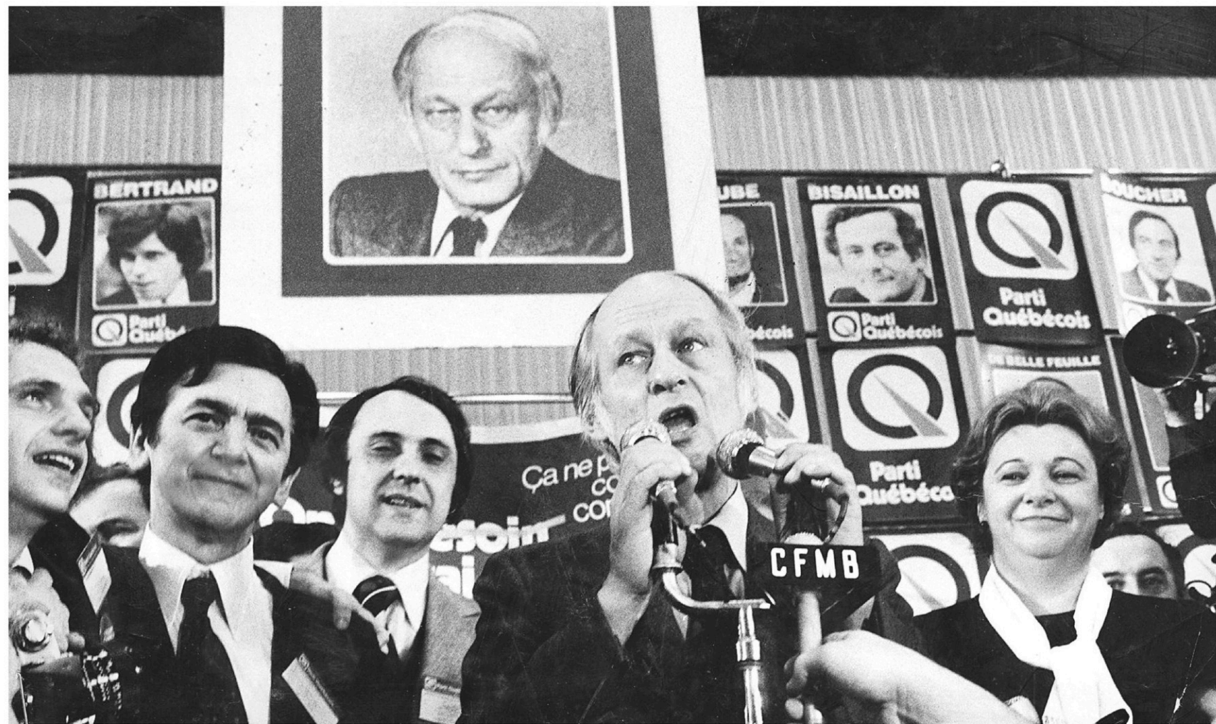
Le docteur Camille Laurin (ici en 1976, deuxième à partir de la gauche) s'est arrêté, en 1983, à extraire « certains irritants » de la loi 101, une reprise du discours patronal... bien des années plus tard.

Mais dans un effort pour rétablir de bonnes relations avec le gouvernement, le Conseil du