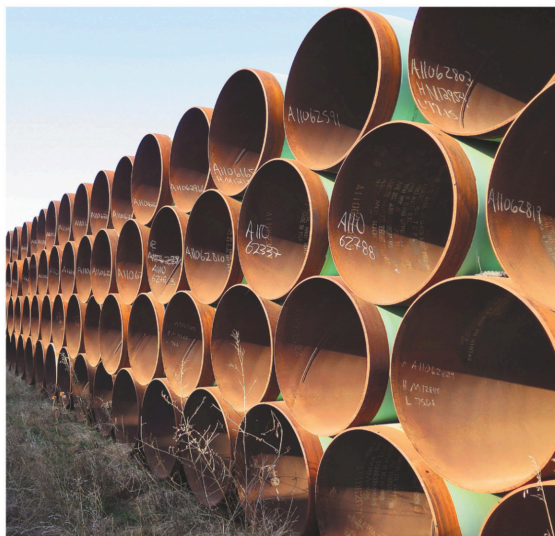
ALEX PANETTA LA PRESSE CANADIENNE

L'organisme a par ailleurs répondu en partie aux demandes formulées par la pétrolière Irving, qui estime que l'évaluation des risques du transport maritime de pétrole lié à Énergie Est n'est pas de son ressort. L'ONE conclut en effet que ces activités de transport « ne font pas partie intégrante du projet », puisque TransCanada n'a « ni la responsabilité ni la charge de telles activités ».