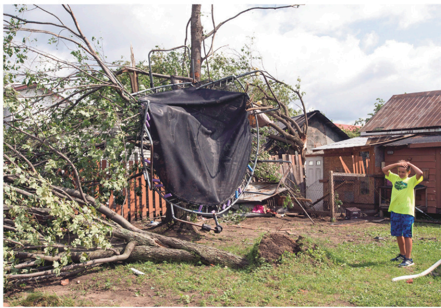
Émile Turcotte regarde avec dépit son trampoline accroché à un arbre après le passage d'une tornade à Lachute, mardi.

rentides et de Lanaudière étaient les plus touchées par les pannes.