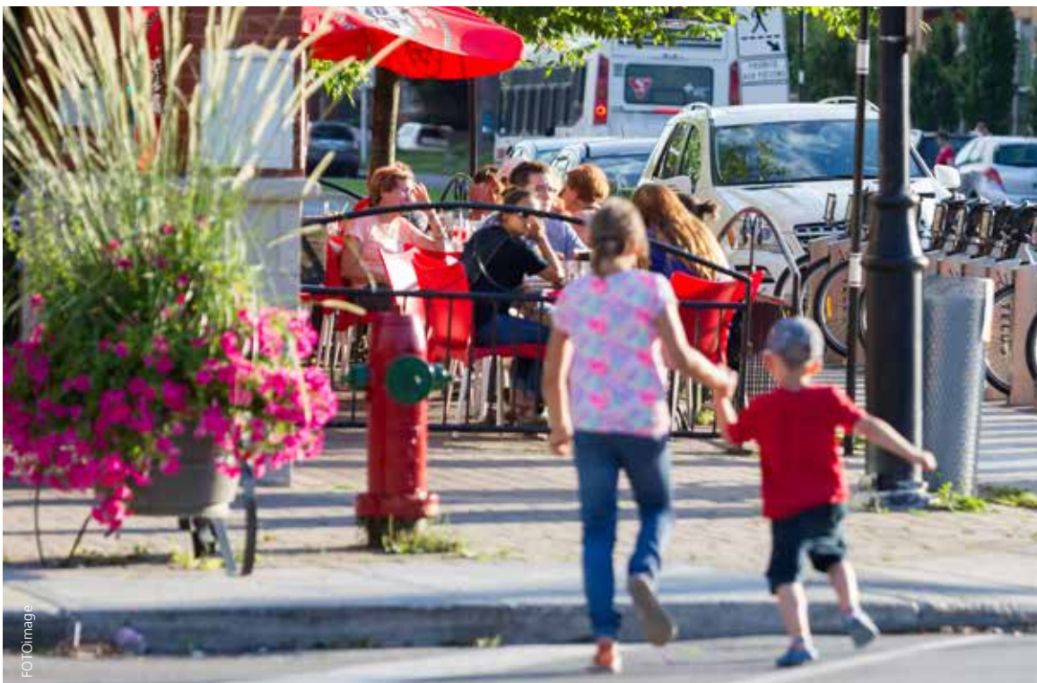
Partage des voies par les piétons, les automobilistes, les autobus et les vélos.