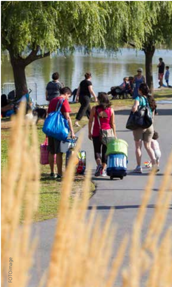
Parc de la Cité

Le réseau cyclable de Longueuil s'étend sur 163 km. Plus de 1 000 cyclistes empruntent chaque jour les pistes des parcs Michel-Chartrand et de la Cité. La passerelle sur la route 116, quant à elle, voit transiter plus de 1 500 cyclistes quotidiennement.