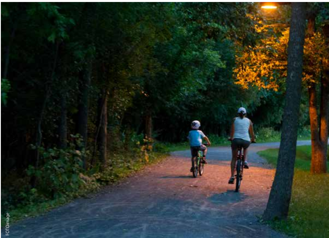
Le réseau cyclable du parc Michel-Chartrand

La démarche entreprise par la Ville au cours de la dernière année a permis de poser les jalons d'une action davantage intégrée et concertée en vue d'améliorer la sécurité en milieu urbain. Cette démarche a fait appel à la participation citoyenne et à la mise en commun des expertises de l'ensemble des services municipaux. S'en dégagent des orientations qui guideront les interventions et les initiatives de notre municipalité en matière de sécurité dans les lieux publics.