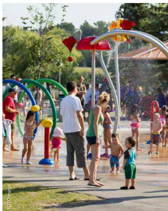
Parc de la Cité

Rendre les lieux publics plus accessibles et plus conviviaux pour tous.