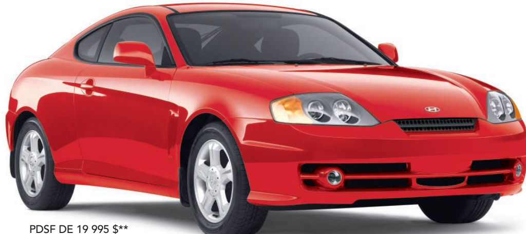
PDSF DE 19 995 $**