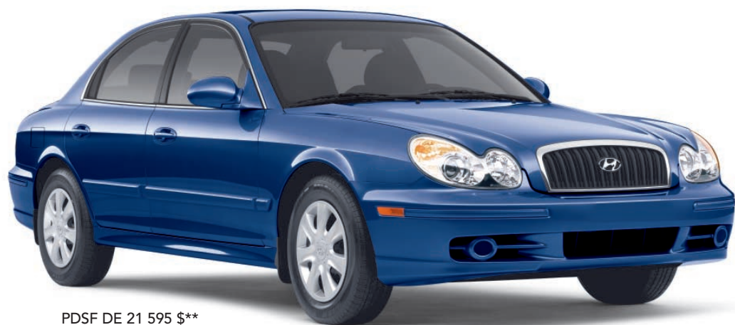
PDSF DE 21 595 $**

LOUEZ À PARTIR DE 165 $* PAR MOIS/60 MOIS OU 0% FINANCEMENT À L'ACHAT†† JUSQU'À 60 MOIS 0 $ DE DÉPÔT SÉCURITÉ Comptant de 2099 $. Transport et préparation inclus.