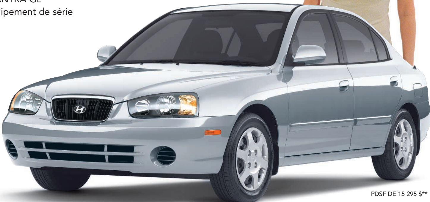
PDSF DE 15 295 $**