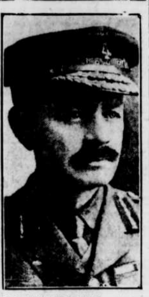
LORD BYNG DE VIMY qui vient d'être nommé gouverneur-général du Canada pour succéder au duc de Devonshire. Il est de la noblesse d'épée anglaise.