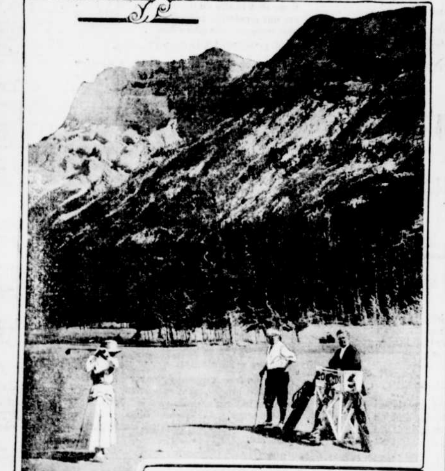
Une vue du terrain de golf de Banff.