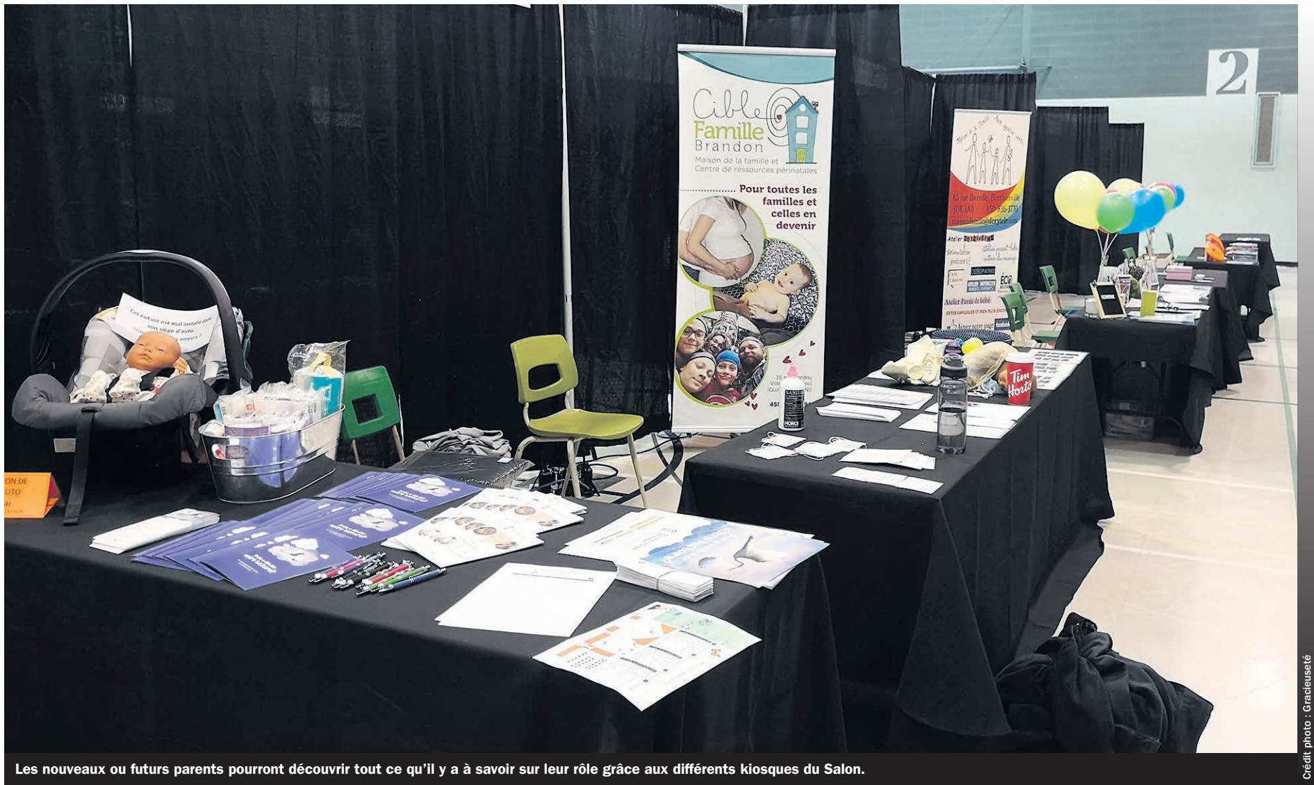
Les nouveaux ou futurs parents pourront découvrir tout ce qu'il y a à savoir sur leur rôle grâce aux différents kiosques du Salon.