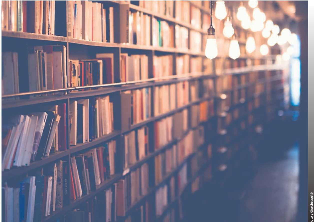
Selon le ministre Mathieu Lacombe, les bibliothèques ont une grande importance pour la promotion de la langue française et de la culture.

La ministre Caroline Proulx se dit aussi très heureuse de cette contribution. « L'aide financière que notre gouvernement octroie aux bibliothèques publiques autonomes démontre l'importance qu'il accorde à la lecture et au savoir pour les jeunes et les moins jeunes. Les livres contribuent à l'éducation et enrichissent la culture d'un peuple et je me réjouis que plusieurs bibliothèques de la région de Lanaudière bénéficient des montants importants afin d'agrandir et de diversifier leur offre de lecture », termine-t-elle. (JJ)