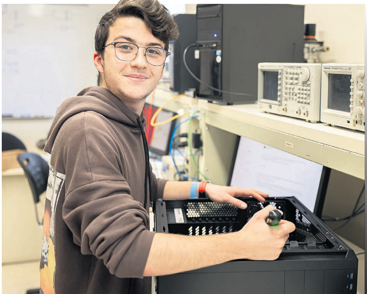
Cette nouvelle technique se veut une mise à jour du programme Technologie de l'électronique qui est offert actuellement au Cégep à Joliette.

Pour en savoir plus sur le programme, visitez le site Web du Cégep à Joliette. (MB)