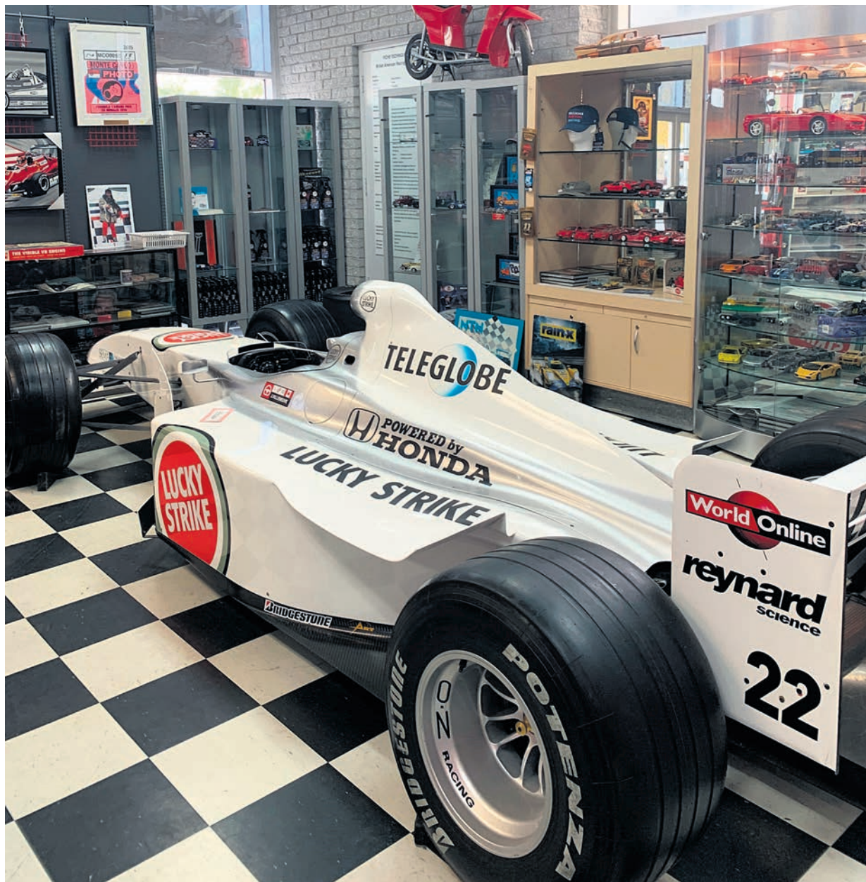
Le Musée Gilles-Villeneuve de Berthierville soulignait ses 35 ans le jeudi 5 octobre dernier.