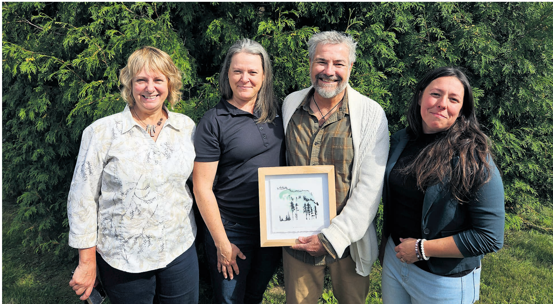
Une première édition de la journée de l'environnement forestier dans Lanaudière.