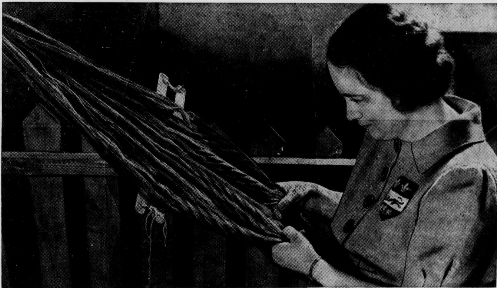
Le tissage de la ceinture flechée traditionnelle