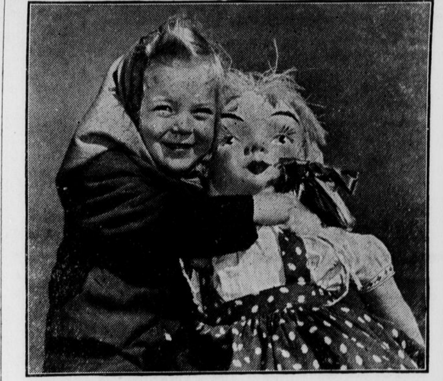
Une prise de photo à quatre ou cinq pieds du sujet vous donnera des premiers plans révélateurs, comme celui-ci.