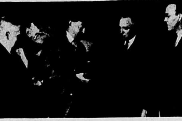
La visite de Son Excellence le vicomte Alexander de Tunis, gouverneur général du Canada, au dépôt du parc Lansdowne, à Ottawa, a marqué l'ouverture de la seconde campagne lancée au pays dans le but de recueillir des vêtements usagés pour les soldats d'Europe.