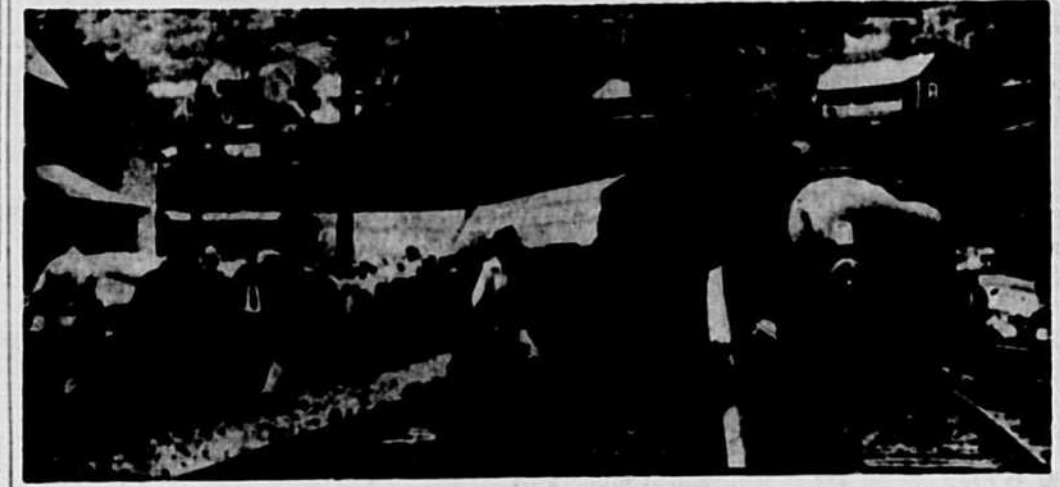
Un chauffeur et un ingénieur du Norfolk and Western's Powhatan Arrow ont perdu la vie après avoir été écrasés par un train d'automobiles qui a dévié de sa voie normale sur une rampe après avoir quitté le rail après s'être engagé à grand vitesse dans une courbe près de Powhatan, en Virginie.