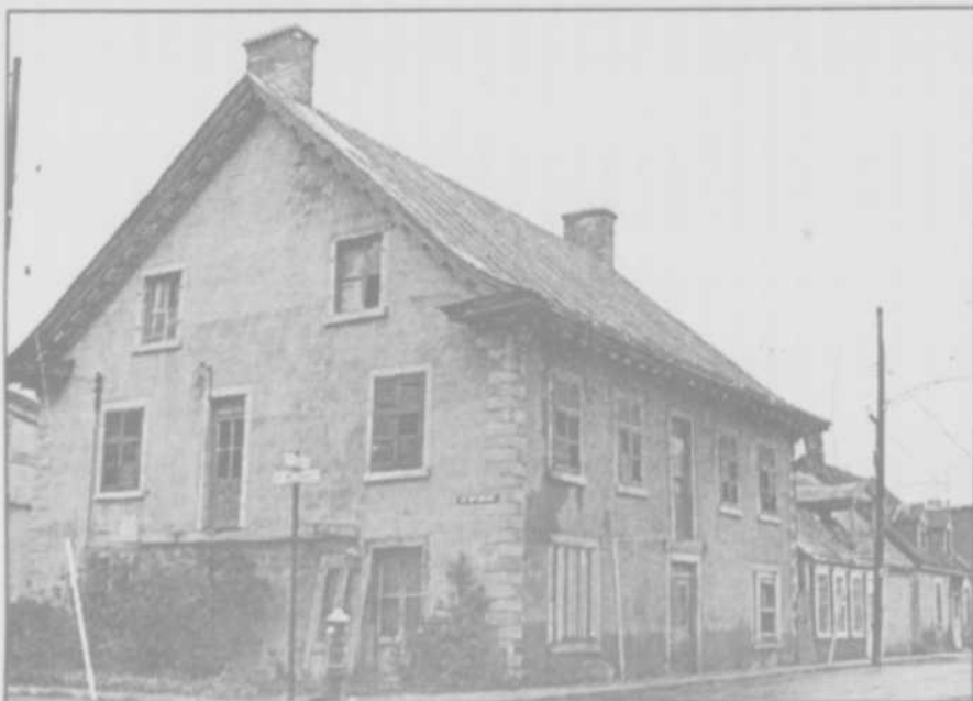
L'imposant immeuble de la succession Prévost, rue Saint-François-Xavier, angle du boulevard des Braves. Désaffecté, il fut démolé en 1965. Il faisait face à la place du Marché. Sur cet emplacement, on a construit l'immeuble actuel (Restaurant l'Impression).