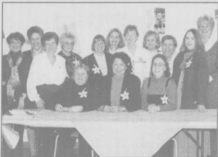
Membre du Centre de FAM (Femmes action dans son milieu) depuis sa fondation en 1974, elle participe aux activités du groupe. Elle oeuvra à titre de cogestionnaire du Centre de 1995 à 1997. Elle est membre des tables de concertation féminine de Lanaudière depuis 1995 et de la MRC des Moulins depuis janvier 1996. On la voit ici avec quelques femmes organisatrices de la Journée de la femme du 8 mars 1997.

Cette Lanaudoise répondait largement aux critères exigés par le prix Hommage Bénévolat Québec, qui sont la persévérance dans son engagement en nombre d'années et d'heures d'engagement, l'impact de ses actions dans son milieu, la tenacité de ses prises de position sociale, la mobilisation qu'elle a engendrée dans le milieu et l'innovation dont elle a fait preuve dans son travail, particulièrement avec les personnes atteintes de déficience intellectuelle. Elle mérite amplement ce titre et c'est avec joie que toute la région la félicite pour cet honneur prestigieux.