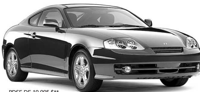
PDSF DE 19 995 $**