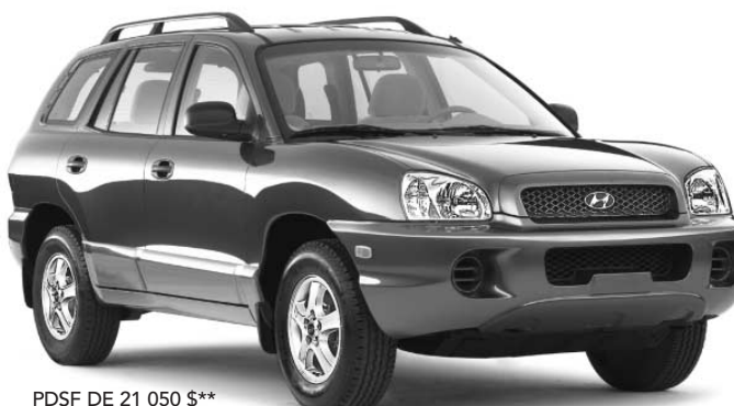
PDSF DE 21 050 $**