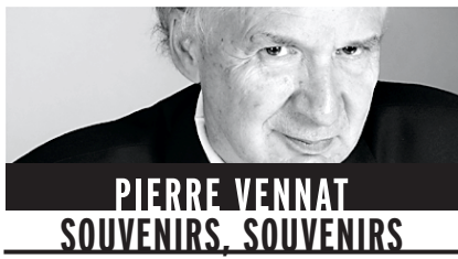
PIERRE VENNAT SOUVENIRS, SOUVENIRS

Le célèbre acteur américain Glenn Ford est non seulement canadien, mais québécois. Et le 1 er mai 1953, alors même qu'il était en vedette à l'Électra, à Montréal, dans le film Le Maître de la gang , il fit sa première visite à Québec, sa ville natale, depuis longtemps.