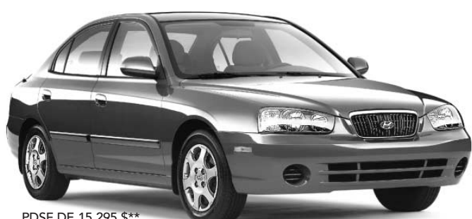
PDSF DE 15 295 $**