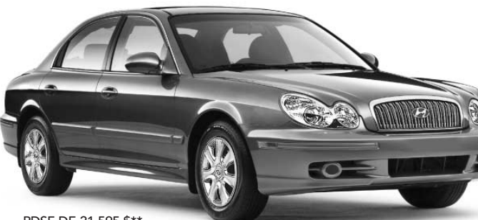
PDSF DE 21 595 $**