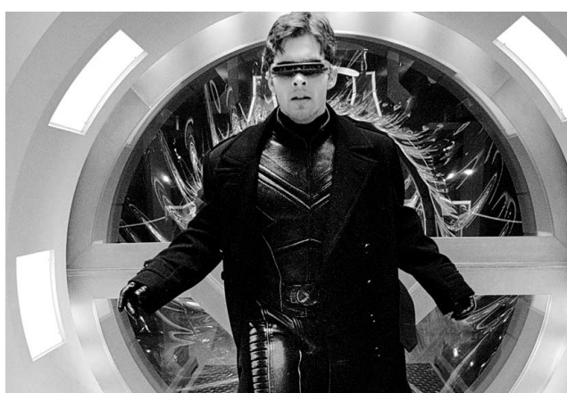
Une scène de X-Men 2 .

Les chiffres définitifs seront publiés aujourd'hui.