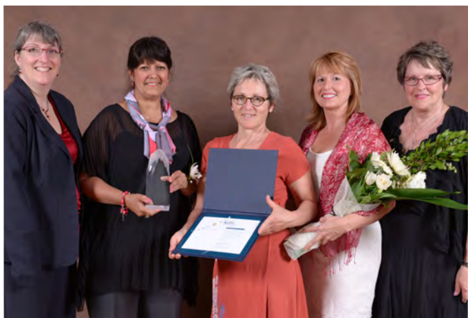
Les représentantes du projet de l'arboretum de l'école Roméo-Forbes

En septembre 2012, le Réseau québécois de Villes et Villages en santé a honoré l'école Roméo-Forbes pour son projet d'arboretum, lors de son concours des Prix d'excellence , dans la catégorie Intelligence collective pour une municipalité de 20 000 habitants et plus. Ce prix lui a été décerné, car la direction de l'école a su rassembler et mobiliser durant près de trois ans les ressources de différentes natures pour réaliser ce projet. En effet, l'Arboretum de l'école Roméo-Forbes doit son existence à l'immense travail de collaboration de tous, au soutien indéfectible des parents et des membres de la communauté ainsi qu'à l'implication essentielle des membres du personnel. Les différents axes de formation de l'arboretum, soit l'intérêt pour la nature et la science, la préservation de l'environnement, la santé, l'intégration au milieu et l'éducation à la citoyenneté, faisaient déjà l'objet d'attentions quotidiennes dans l'école.