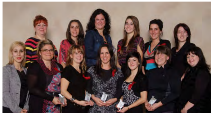
Les récipiendaires de la CSSH à la 15 e édition du Concours québécois en entrepreneuriat

Lors de la 15 e édition du Concours québécois en entrepreneuriat, deux projets émanant de la CSSH ont reçu des honneurs. Le projet « Joue la bonne carte » de la polyvalente Hyacinthe-Delorme a obtenu le prix national du 2 e cycle du secondaire, alors que le projet « Pikado » de l'école Henri-Bachand a été le lauréat du prix Coup de cœur régional Montérégie 2013 pour le 3 e cycle du primaire.