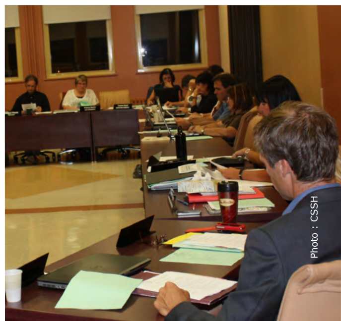
Séance du conseil des commissaires

En février dernier, les commissaires ont procédé à l'adoption d'une politique culturelle pour la commission scolaire. Cette politique prévoit la mise sur pied d'un comité culturel qui aura le mandat d'élaborer un plan d'action, en plus de voir à recueillir et à diffuser les propositions des différents programmes et partenaires culturels. Cette nouvelle politique permettra à la CSSH de jouer un rôle encore plus actif au regard de la culture et de la promotion de celle-ci.