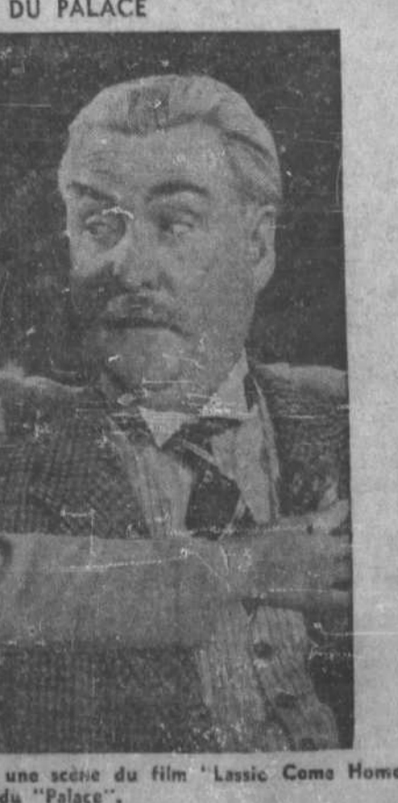
Elizabeth Taylor et Nigel Bruce, dans une scène du film "Lassie Come Home", qui est cette semaine à l'affiche du "Palace".