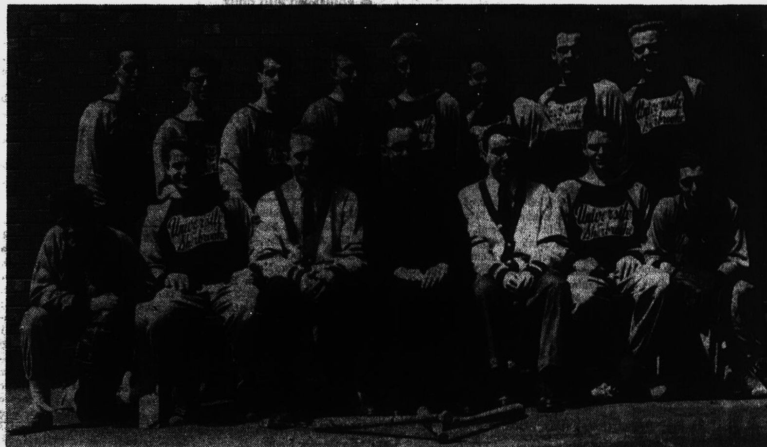
On voit sur cette photographie les membres de l'équipe de balle molle de l'Université de Sherbrooke, laquelle équipe notre population aura l'avantage de voir aux prises avec le club "All Stars" de Lac-Mégantic, sur le terrain du collège, dimanche soir le 3 juillet, à 8 heures.