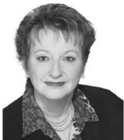
France Bonsant Députée Compton-Stanstead

C'est un honneur et un privilège pour moi de représenter mes concitoyens et concitoyennes de Compton à la chambre des Communes. Merci de votre confiance.