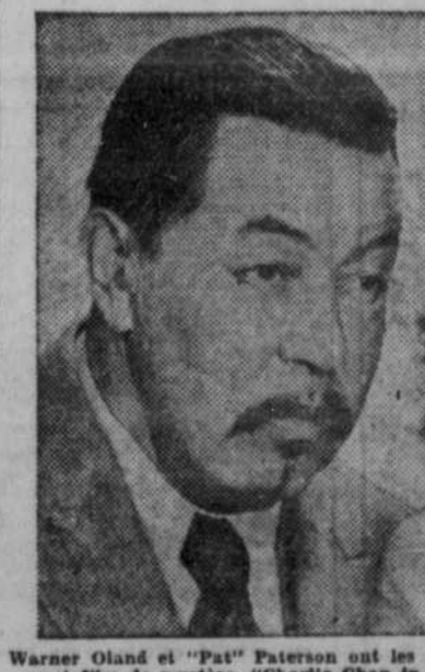
Warner Oland et "Pat" Paterson ont les rôles de vedettes dans ce tout dernier et émouvant film de mystère, "Charlie Chan in Egypt".