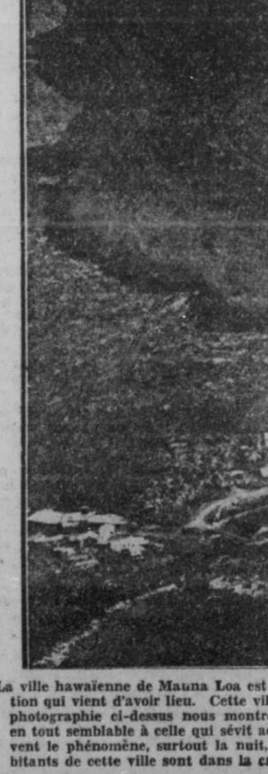
La ville haïtienne de Matina Loa est menacée de destruction par une éruption qui vient d'avoir lieu. Cette ville a une population de 20,000 âmes. La photographie ci-dessus nous montre ce que fut une précédente éruption en tout semblable à celle qui sévit actuellement là-bas. Les touristes trouvant le phénomène, surtout la nuit, absolument merveilleux, les habitants de cette ville sont dans la crainte.