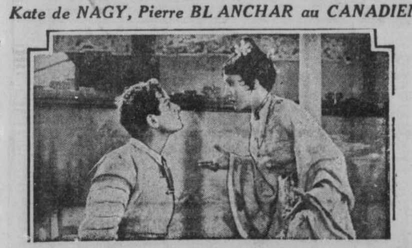
Une scène de TURANDOT, princesse de Chine avec LE SECRET D'UNE NUIT au Canadien.

"ROTHCHILD" Magnifique spectacle sans pareil. Diver- tisement éblouissant pour les yeux et pour les oreilles! GEORGE WHITE'S 1935 SCANDALS ALICE FAYE JAMES DUNN NED SPARKS LYDA ROBERTI CLIFF EDWARDS GEORGE WHITE