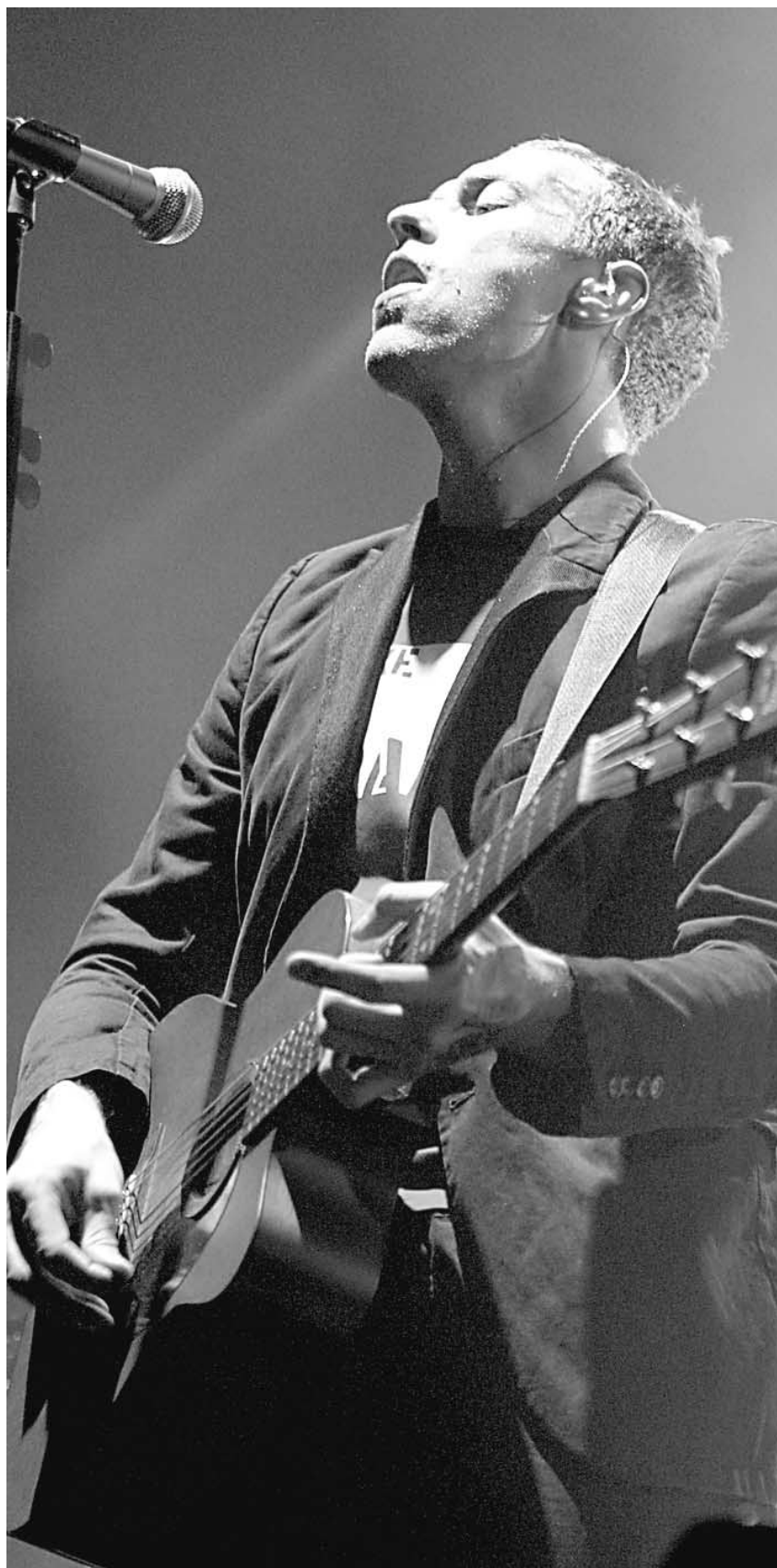
Chris Martin, sur la scène du Centre Bell, hier soir.

Seule ombre au tableau, on aurait aimé que Coldplay se lâche un peu plus. Trop souvent, on avait le sentiment que le quatuor se faisait un point d'honneur de coller aux versions enregistrées de leurs chansons. L'énergie était différente, bien sûr, mais il aurait été intéressant de les voir réinventer leurs chansons. Il ne s'agit là que d'un irritant mineur, qui n'a pas empêché d'apprécier cette leçon de pop bien ficelé et aux mélodies prenantes.