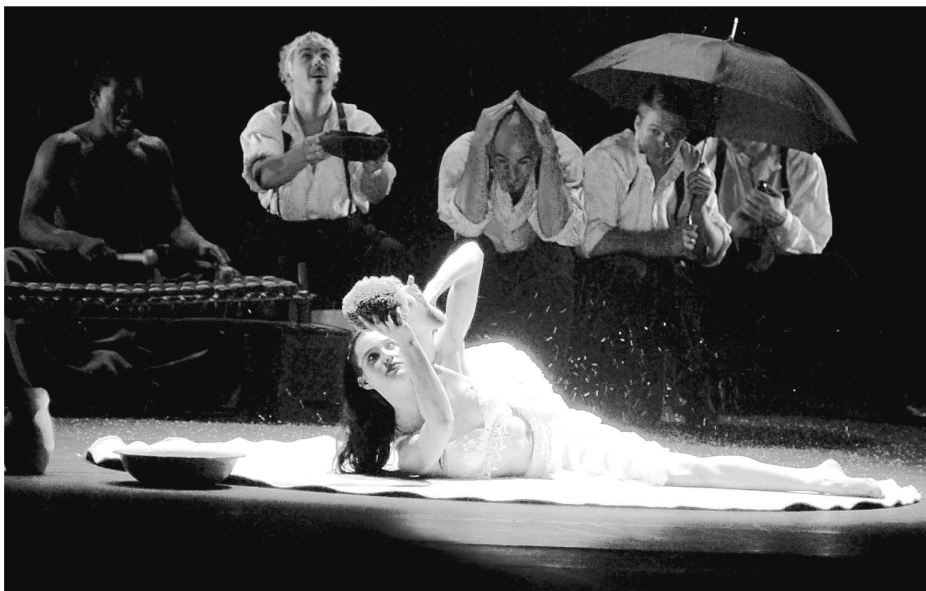
Nomade, c'est l'envers du cirque traditionnel alors que rien n'éclate, rien ne tonne et rien n'étourdit le grand public.