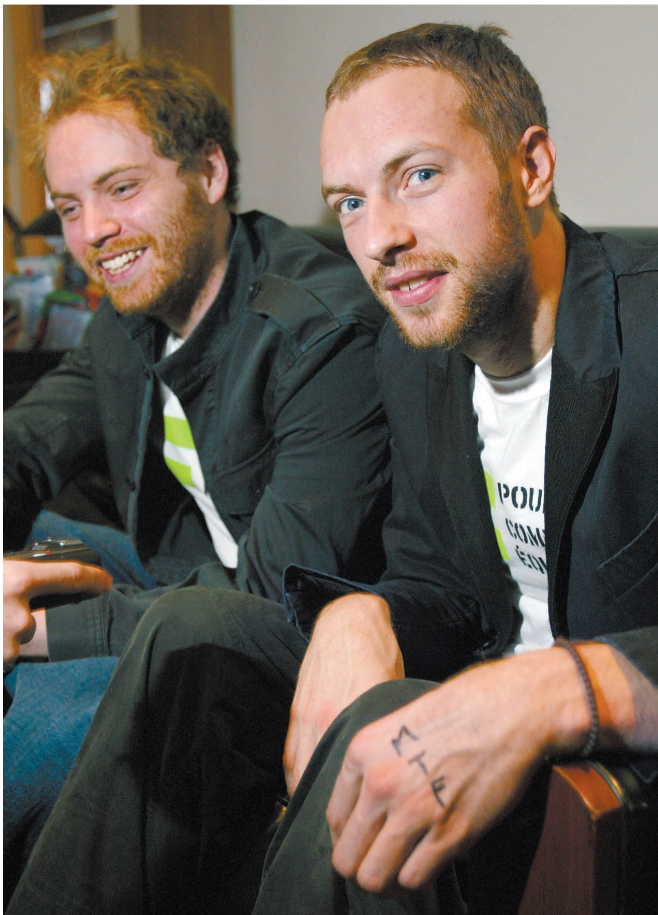
Le guitariste Jon Buckland et le chanteur Chris Martin ont pris le temps de parler de leur engagement envers la campagne Pour un commerce équitable, d'Oxfam.

L'irrésistible ascension de Coldplay a été confirmée la semaine dernière par quatre prix. Deux Brit Awards (meilleur groupe et meilleur album) et deux prix Grammy (meilleur performance rock par un groupe et meilleur album alternatif). Une marque de respect que les deux musiciens acceptent avec une certaine réserve. Jeudi dernier, à Londres, Chris Martin a d'ailleurs déclaré que les prix n'avaient aucune signification. Surtout dans un contexte va-t-en-guerre. « Ça fait plaisir de recevoir des prix même si on n'y croit pas, nuance Jon Buck-