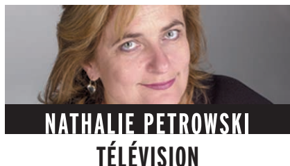
NATHALIE PETROWSKI TÉLÉVISION