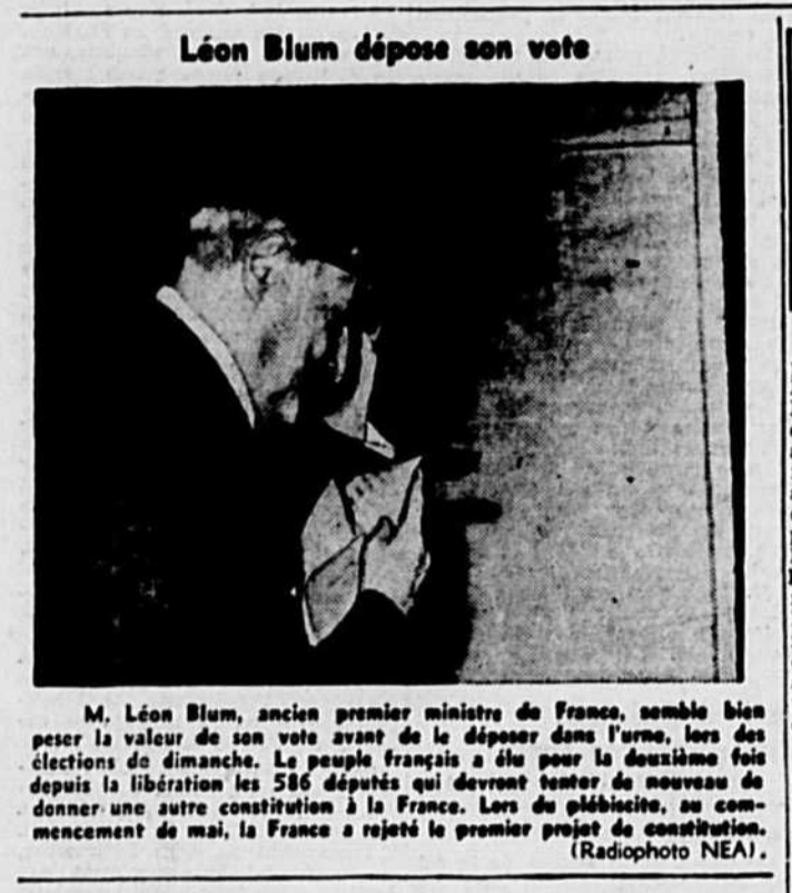
Léon Blum dépose son vote

M. Léon Blum, ancien premier ministre de France, semble bien peser la valeur de son vote avant de le déposer dans l'urne, lors des élections de dimanche. Le peuple français a élu pour la deuxième fois depuis la libération les 586 députés qui devront voter de nouveau de donner une autre constitution à la France. Lors de l'abstention, le commencement de mai, la France a rejeté le premier projet de constitution.