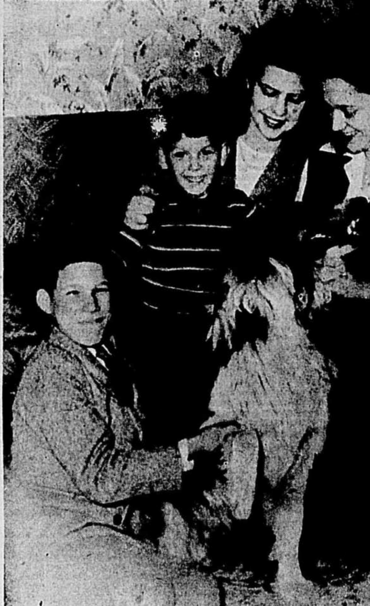
Et voici toute la famille réunie: même le chien ne veut pas être oublié. Il fut voir jusqu'à quel point il est attaché à ses enfants. Foyer qui serait vide, foyer aujourd'hui rempli: deux garçons, deux filles, quatre enfants heureux, quatre amours d'enfants. En face de ces vies bâties, on sent la grandeur de cette oeuvre de l'adoption; on sent également le respect qu'on doit avoir pour ces petits et avec quel amour une oeuvre comme celle-ci doit s'entreprendre. Bénévoles de vie, constructeurs de bonheur, voilà l'enseignement que l'on pourrait accrocher, avec raison, à chacun de nos 7,000 foyers d'adoption. L'oeuvre responsable de tels bonheurs, la Société d'adoption et de protection de l'enfance fait appel à votre générosité à l'occasion de sa campagne annuelle du dix sous. Aidez-la à mener à bien son travail.