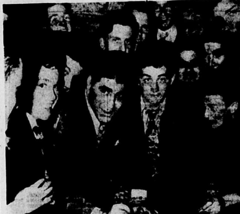
Le champion mondial des lutteurs, Bobby Managoff de Chicago, est toujours aussi populaire...