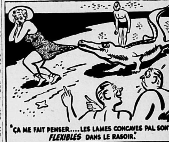
ÇA ME FAIT PENSER... LES LAMES CONCAVES PAL SONT FLEXIBLES DANS LE RASOIR.