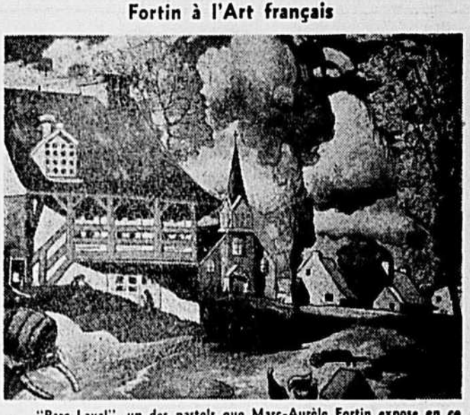
"Parc Laval", un des pastels que Marc-Aurèle Fortin expose en ce moment à l'Art français, galerie située à 370 ouest, rue Laurier.

Des milliards de gallons d'eau sont transformés en énergie électrique qui est ensuite utilisée dans les usines de production d'aluminium d'Arvida. Tel est le thème d'un documentaire de l'O.N.F., réalisé dans la région du Saguenay sous le titre de: "Shipshaw".