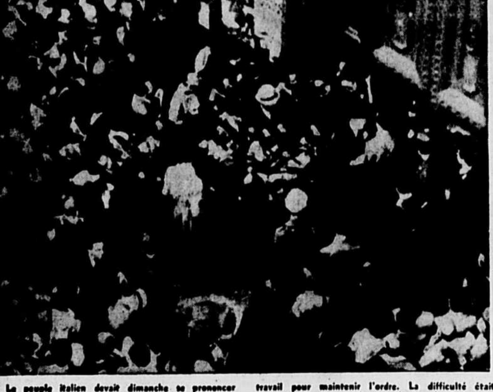
Le peuple Italien devait dimanche se prononcer sur une question de primordiale importance pour l'avenir de son gouvernement. Les lieux de vote ont été pris d'assaut, comme le démontre cette photo, obligeant ce contingent de police à un dur travail pour maintenir l'ordre. La difficulté était d'autant plus grande, dans ce district de Rome, que la salle de votation n'avait qu'une seule porte qui devait servir d'entrée et de sortie. Les Italiens avaient à se prononcer sur le maintien de la monarchie.