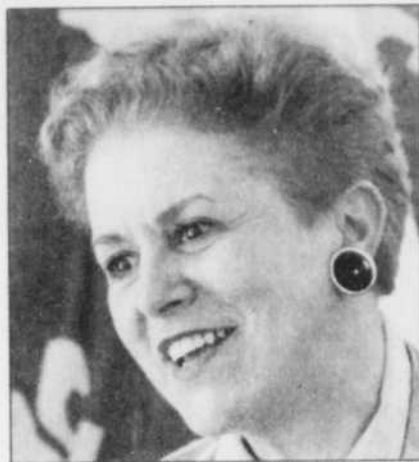
La ministre de l'Emploi, Louise Harel.

C'est la Société québécoise de développement de la main-d'oeuvre qui sera chargée d'élaborer la réglementation du projet de loi, mais Mme Harel indiquait déjà, hier, que plusieurs ty-