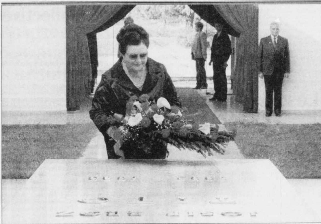
Madame Jovanka Broz, veuve du maréchal Tito, dont c'était le 15 e anniversaire du décès hier, dépose une gerbe de fleurs sur la tombe du défunt à Belgrade. Le maréchal Tito a été président de la Yougoslavie de 1945 à 1980.

Pire que ce que prédisaient les sondages