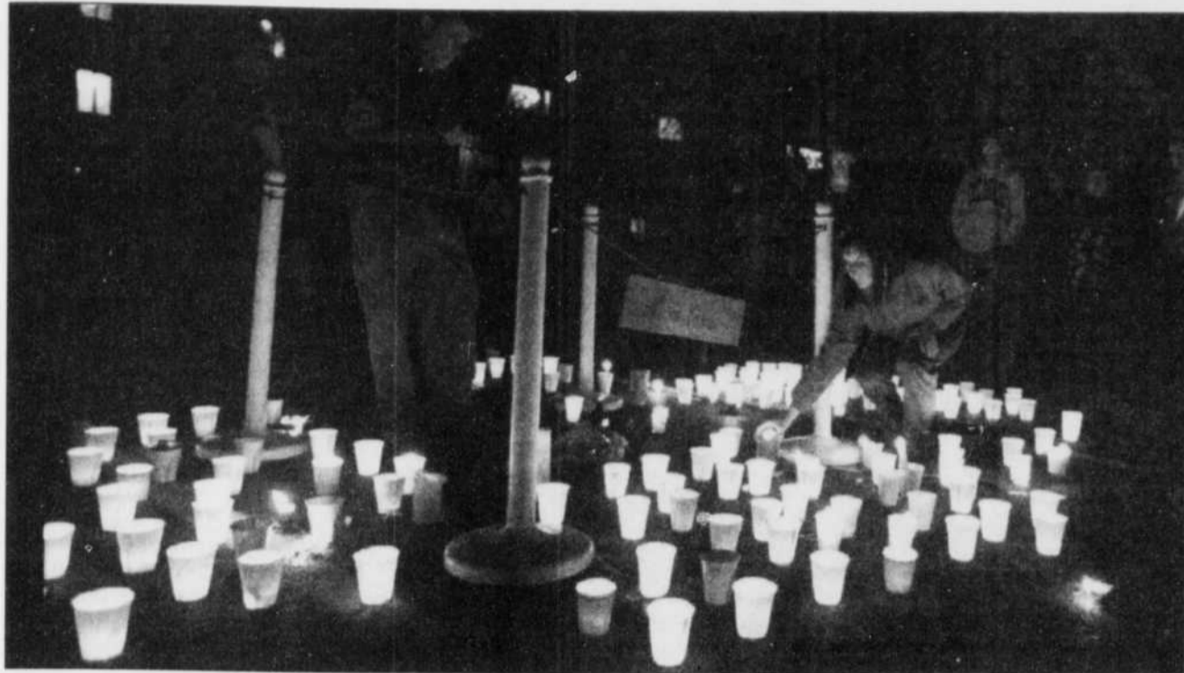
Des étudiants de l'université Kent ont allumé des chandelles hier sur le site où ont péri quatre-vingt-cinq étudiants il y a 25 ans lors d'un affrontement avec la Garde nationale de l'Ohio. L'événement constitue un point tournant dans le mouvement d'opposition à la guerre du Vietnam.