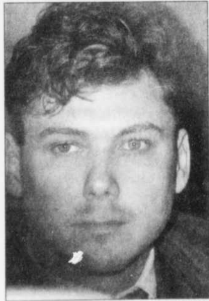
Paul Bernardo est accusé du meurtre de deux adolescentes.