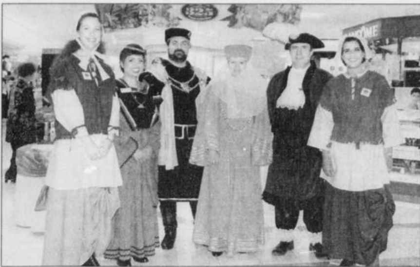
LE SOLEIL, JACQUES DESCHÊNES

La plus ancienne—La compagnie La Baie d'Hudson célèbre, ces jours-ci, le 325 e anniversaire de sa fondation, ce qui fait de cette entreprise la plus vieille compagnie incorporée du monde entier. Pour célébrer l'événement, tout est en vente dans les magasins La Baie jusqu'au 7 mai et les employés de ces magasins revêtent des costumes d'époque pour accueillir les visiteurs. Cette photographie a été prise mercredi dans le magasin La Baie des Galeries de la Capitale. La direction avait loué 70 costumes pour la circonstance. Les employés du magasin La Baie de Place Fleur de Lys les ont déjà portés et demain, ce sont ceux de Place Laurier qui s'en accourront.