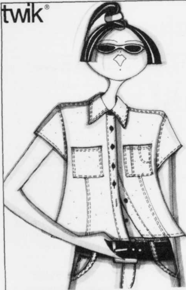
Nouvelle forme de la manche cape LE CINTRÉ DENIM 29. 95

Grande allure d'un petit chemisier denim indigo, taillé tout en découpes surpiquées contrastantes. Minipoches plaquées, boutons de corne. P.m.g.