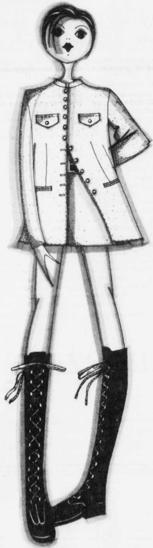
Chevrons de lin LE VESTON MANDARIN 119. 95

Coupé spécialement pour Twik, long veston quatre poches, légèrement ajusté, simple boutonnage boutons de coco, col mao à coordonner à sa jupe ligne A, 49.95 Sable. 5 à 13.