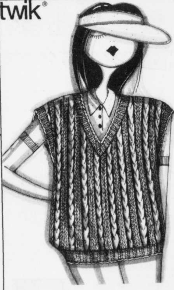
Tricot pur coton DÉBARDEUR SPORTS ÉTÉ 39. 95

la maison simons PLACE STE-FGY GALERIES DE LA CAPITALE VIEUX QUÉBEC