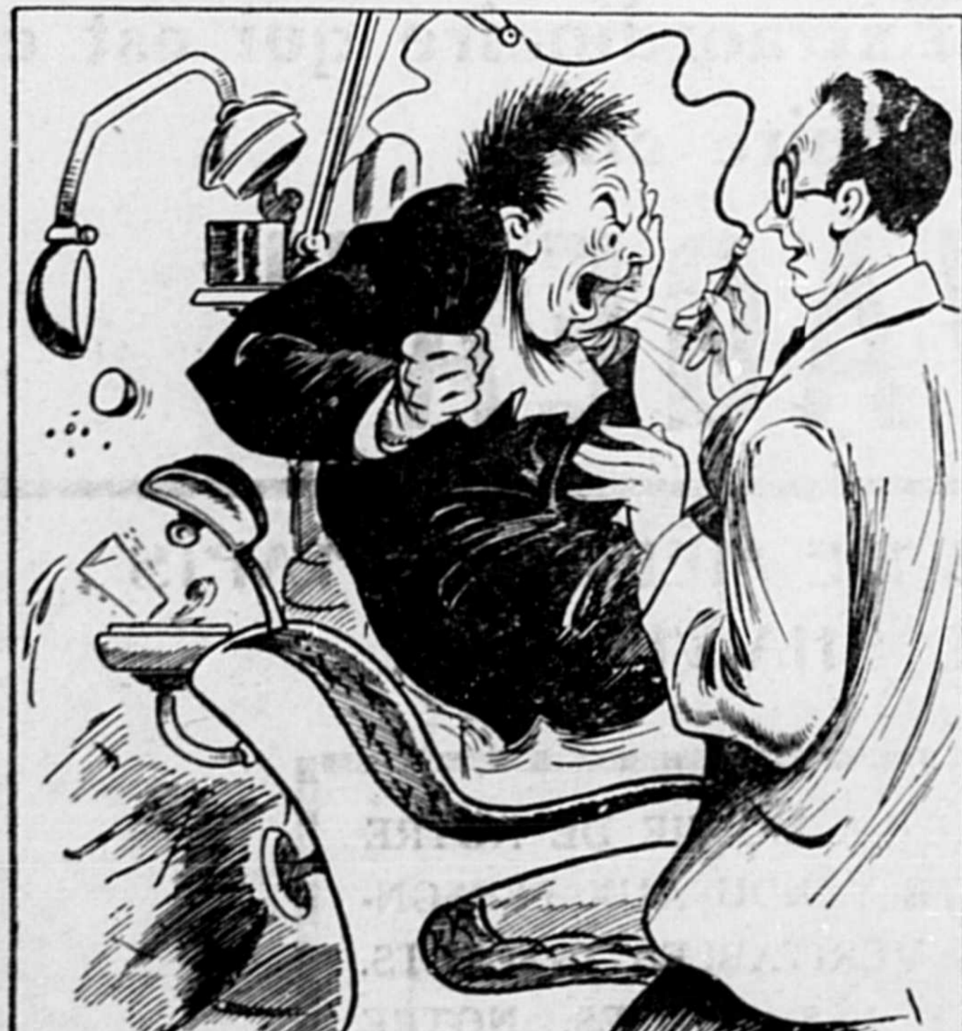
LORSQUE SOUDAIN LA PERFORATRICE INFERNALE TOUCHE LE NERF ET TU REÇOIS UN CHOC DE TOUTS LES DIABLES.