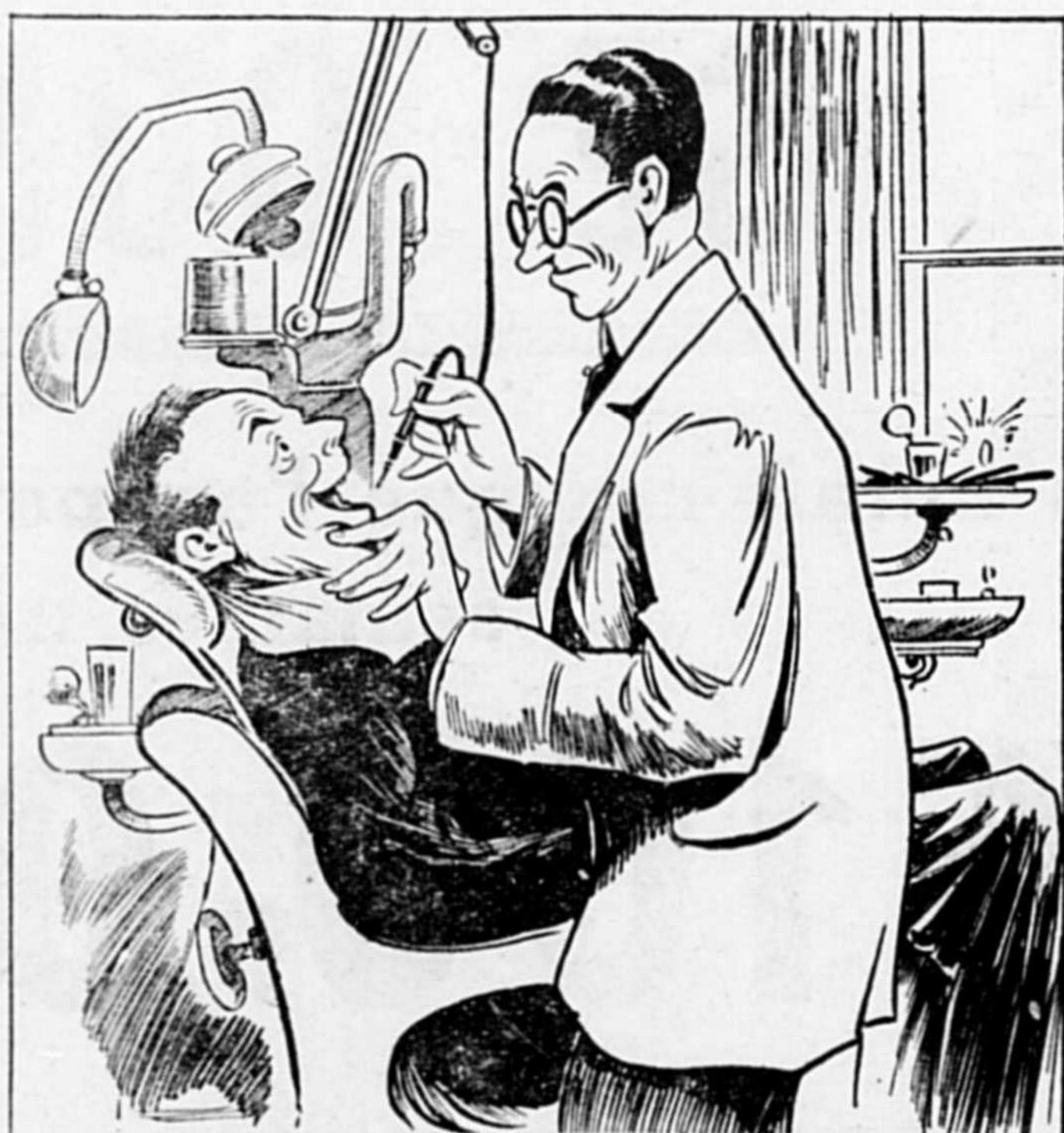
ET APRÈS QUE LE DENTISME T'À TÂTÉ SOUS TOUTS LES SENS SANS TE FAIRE MAL, TU COMMENCES À TROUVER TA FRAYEUR, RIDICULE ET À REPRENDRE CONFIANCE -