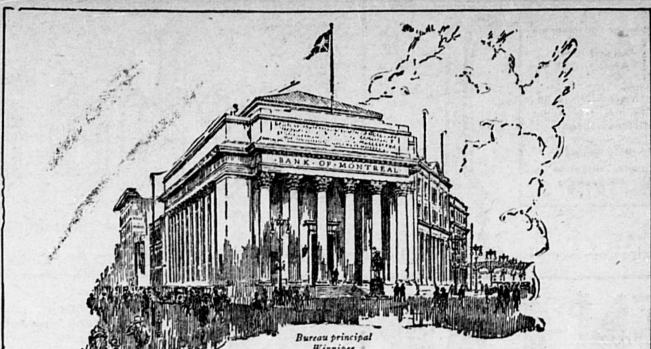
Bureau principal Winnipeg