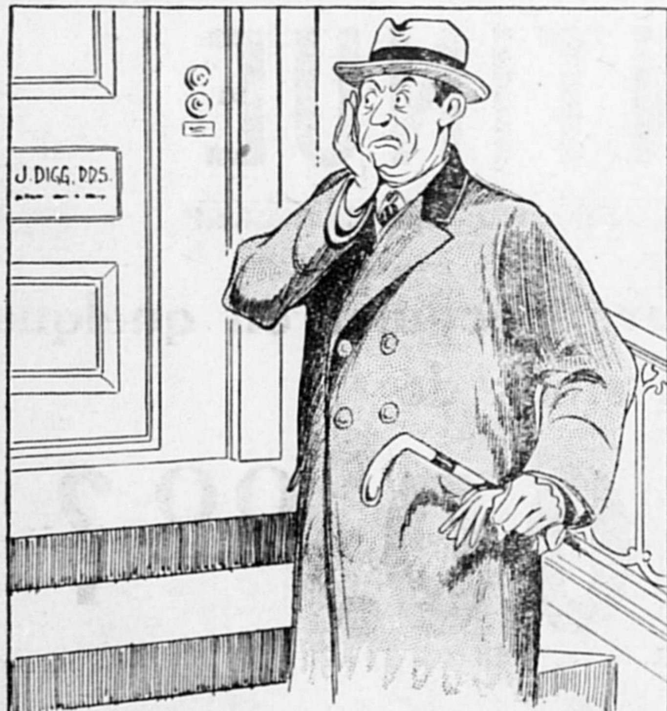
T'AS-PAS DÉJÀ MOBILISÉ TOUT TON COURAGE POUR ALLER FAIRE REMPLIR UNE MOLAIRE DOULOUREUSE -