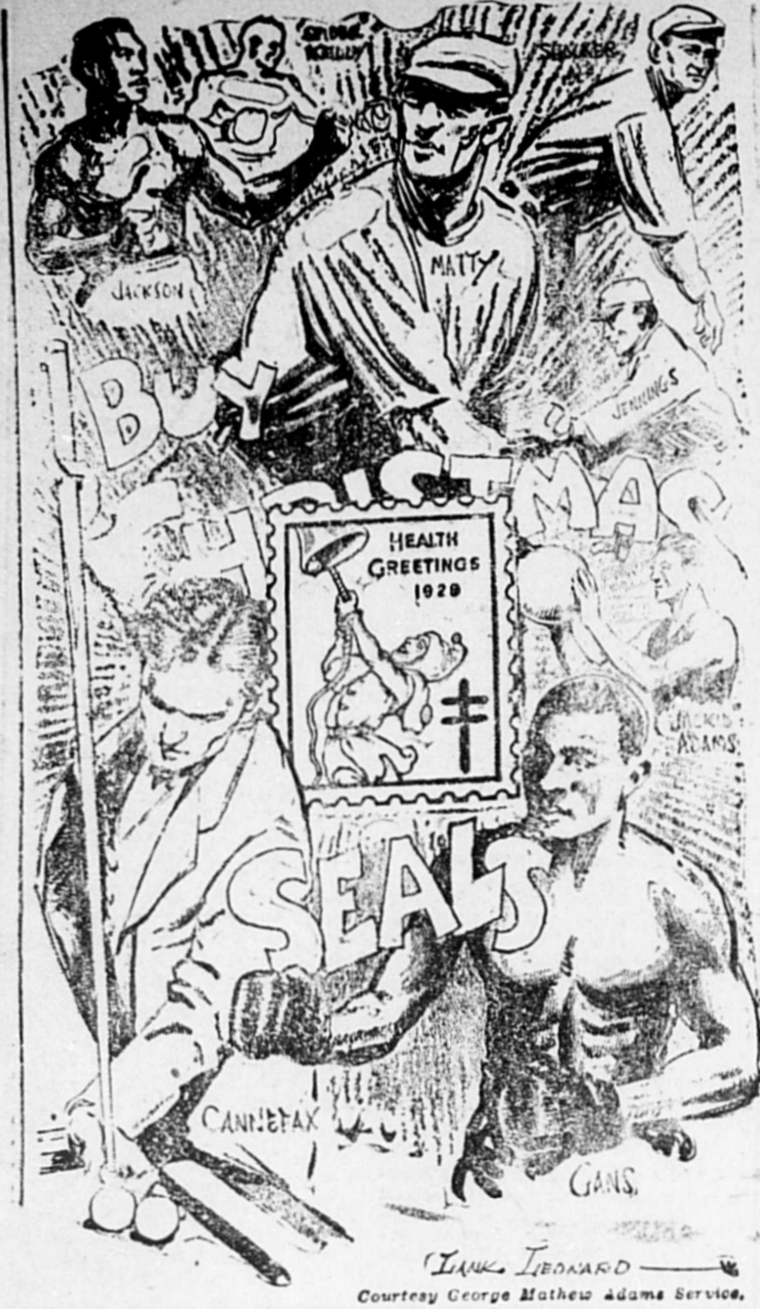
Champions bien connus que la tuberculose a terrassés.