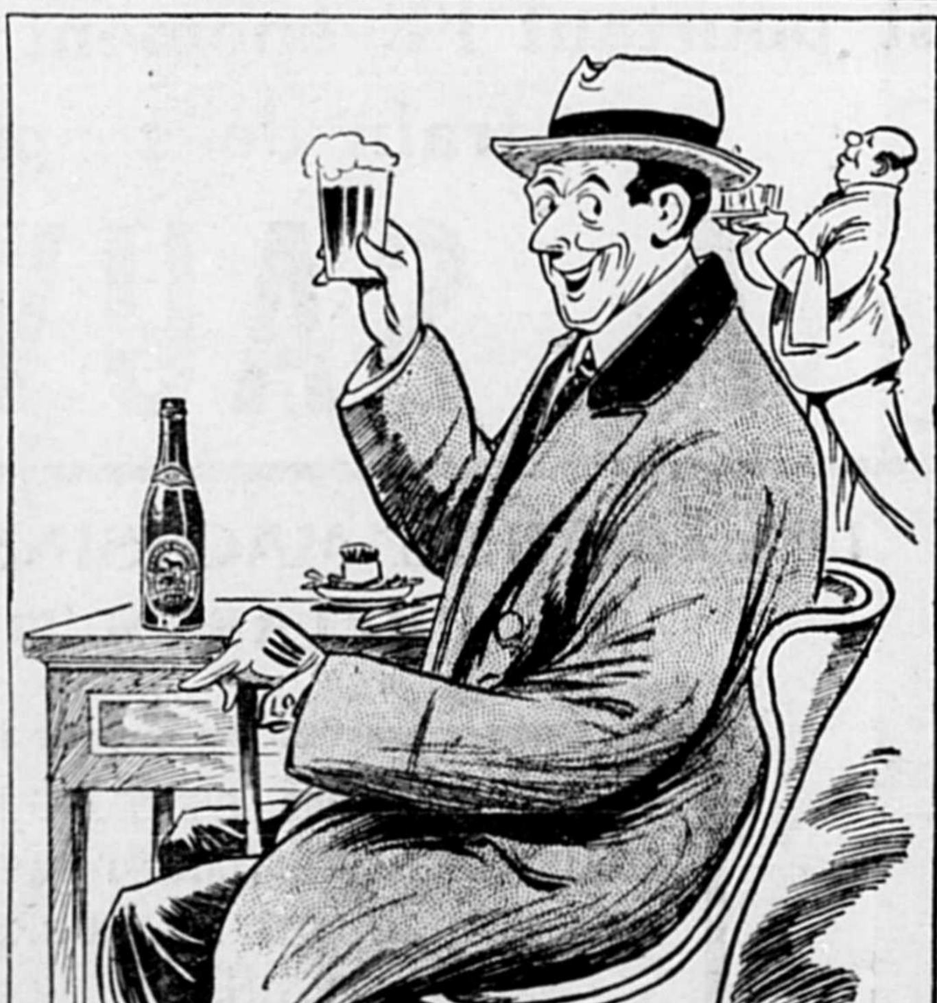
T'AS PAS DÉJÀ ESSAYÉ UNE BLACK HORSE ? ÇA PROUVE QUE TU AS ENCORE TA DENT DE SAGESSE.