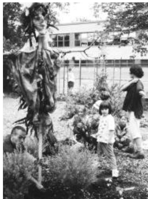
Les jardins Mentana