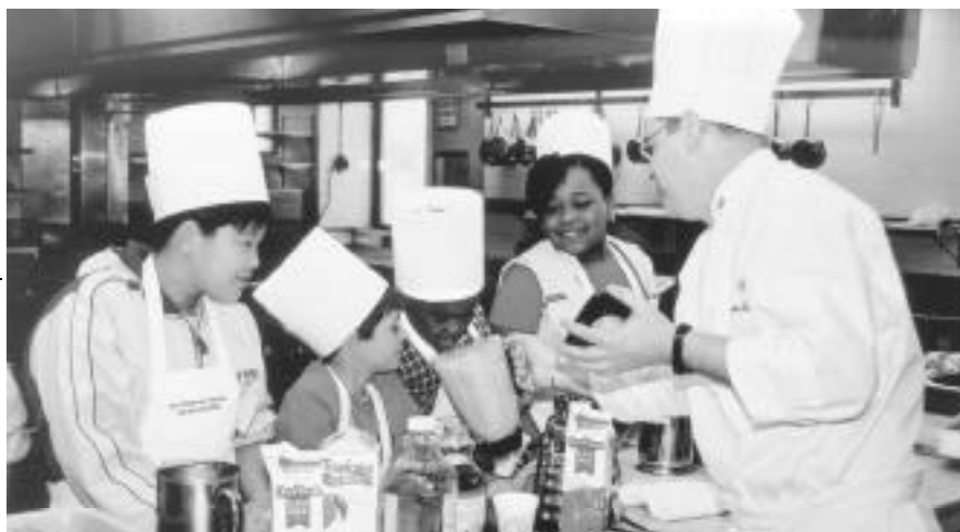
Un atelier avec des écoliers de Pointe Saint-Charles