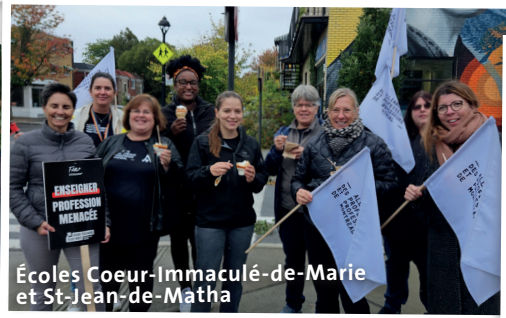
Écoles Coeur-Immaculé-de-Marie et St-Jean-de-Matha