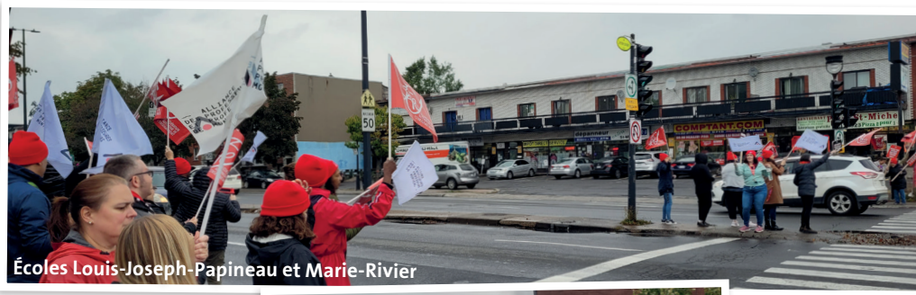
Écoles Louis-Joseph-Papineau et Marie-Rivier