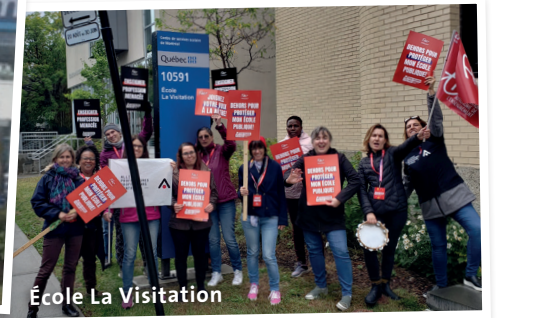
École La Visitation