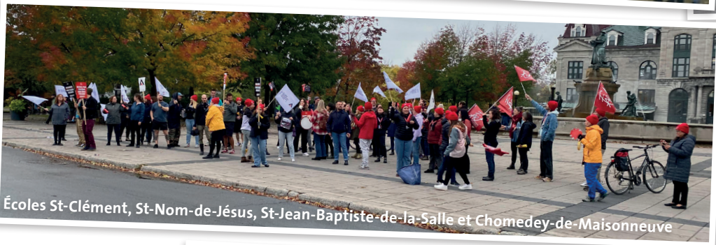
Écoles St-Clément, St-Nom-de-Jésus, St-Jean-Baptiste-de-la-Salle et Chomedey-de-Maisonneuve