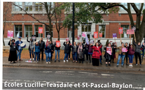
Écoles Lucille-Teasdale et St-Pascal-Baylon