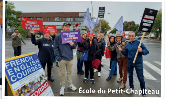
École du Petit-Chapiteau

▲ Les profs de l'école Christ-Roi sont collectivement allés remettre à leur direction la lettre dénonçant le fait qu'ils sont sans contrat de travail depuis 6 mois.