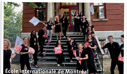
École internationale de Montréal