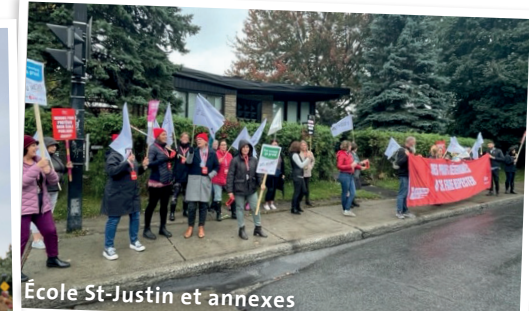
École St-Justin et annexes