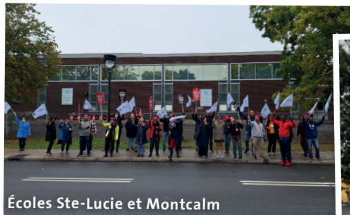
Écoles Ste-Lucie et Montcalm