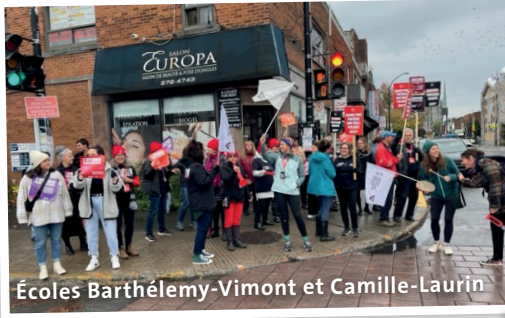
Écoles Barthélemy-Vimont et Camille-Laurin