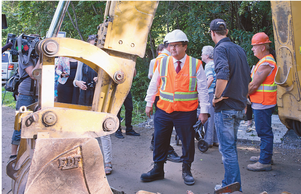
Le maire de Montréal Denis Coderre avec casque, lunettes et bottes de sécurité.

« Le message qu'on envoie aujourd'hui, c'est que Postes Canada