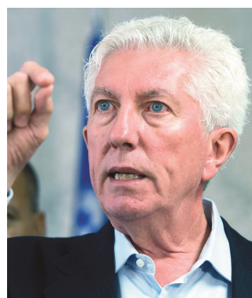
« On a un discours qui est moderne, progressiste, réaliste, démocratique et souverainiste », a affirmé jeudi Gilles Duceppe.

« L'environnement, ça concerne certainement les jeunes. La défense des intérêts du Québec, ça concerne certainement les jeunes. La sécurité et la liberté, ça concerne certainement les jeunes », a-t-il poursuivi en opposant le Bloc au NPD de Thomas Mulcair, comme il l'avait fait plus tôt en journée.