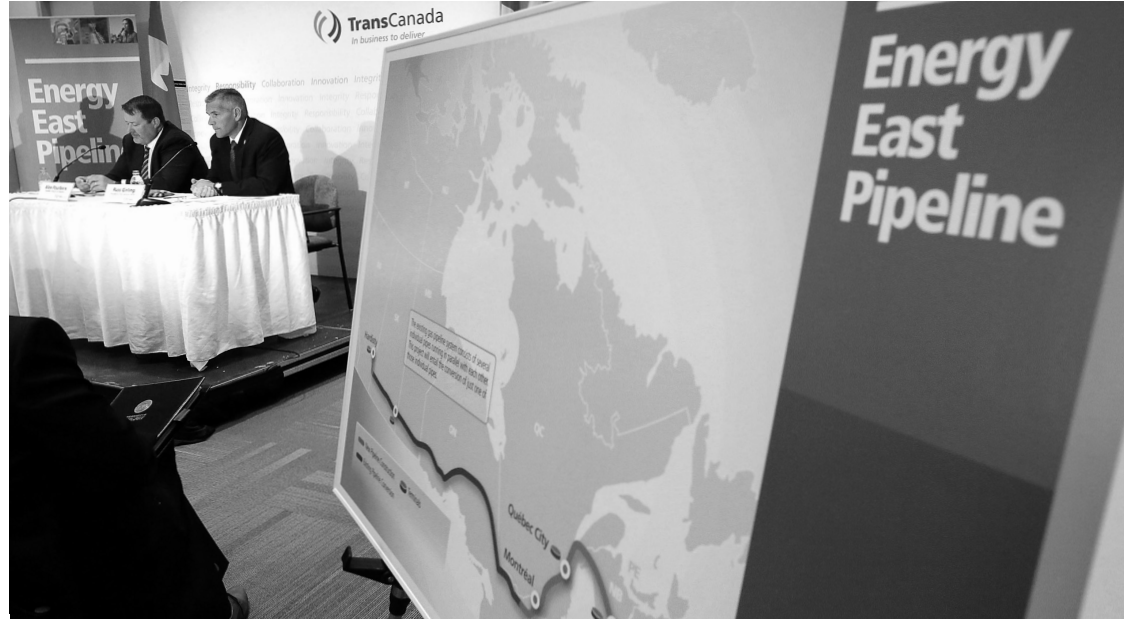
Des responsables du projet Énergie Est devant le tracé prévu du pipeline de TransCanada.

Le pétrole qui coulera dans le pipeline doit aussi traverser plusieurs « zones écosensibles », dont huit parcs provinciaux, quatre réserves de conservation et quatre zones de conservation. La CEO constate d'ailleurs l'absence d'information détaillée « sur les incidences et les plans d'at-