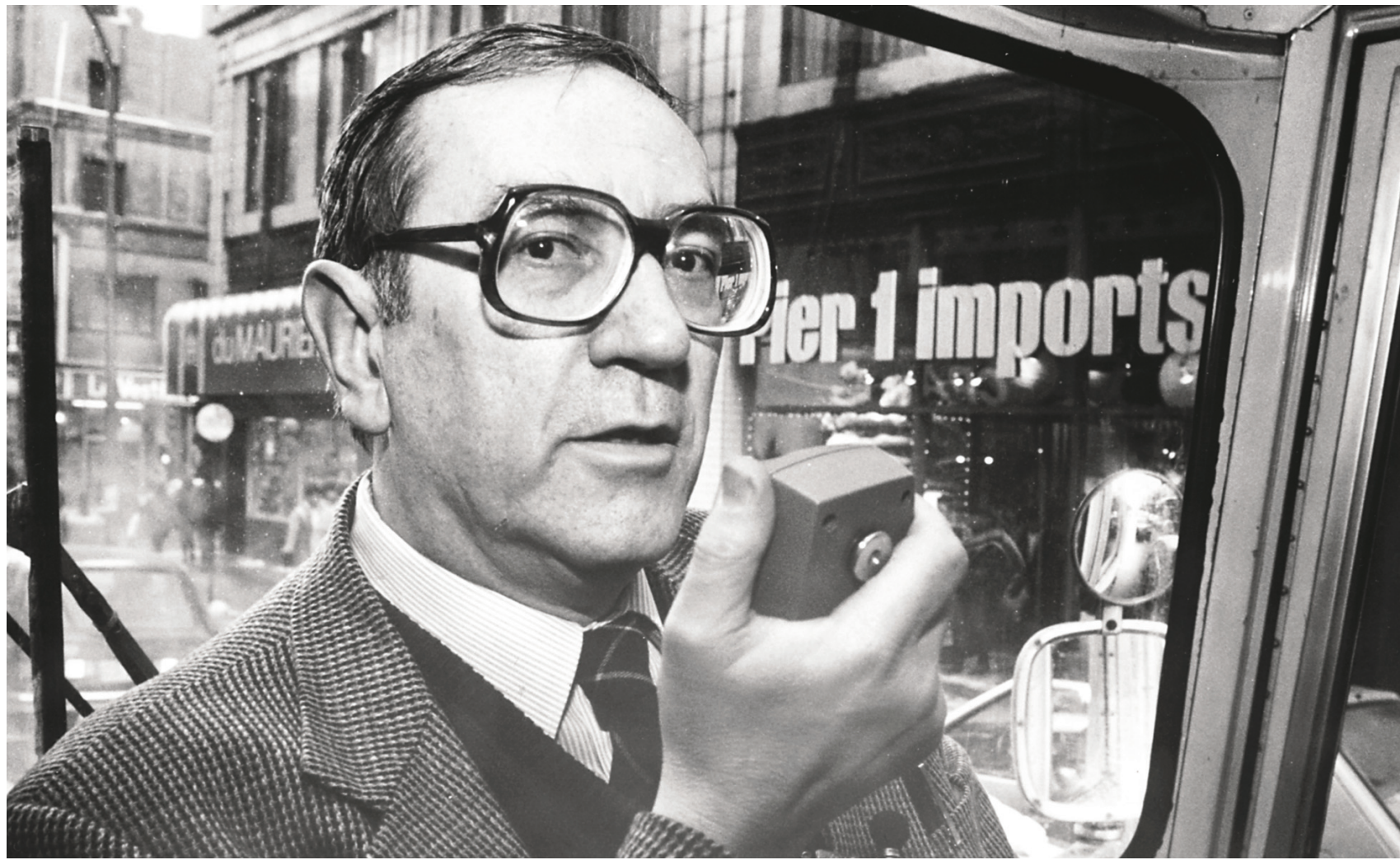
LA PRESSE CANADIENNE

Il serait temps que des hommes disent aux autres hommes que leur comportement est criminel et que ça suffit