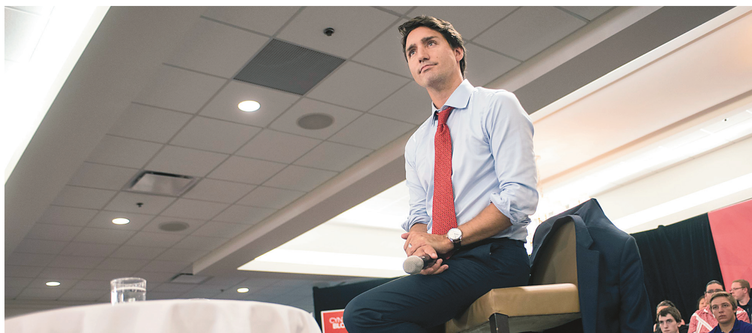
« Les systèmes d'éducation des Premières Nations sont chroniquement sous-financés », a dit jeudi le chef libéral Justin Trudeau, de passage en Saskatchewan.