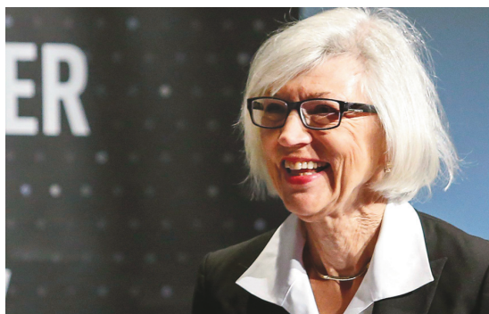
La juge en chef de la Cour suprême du Canada, Beverley McLachlin

« Avoir des juges sur le banc avec diverses expé-