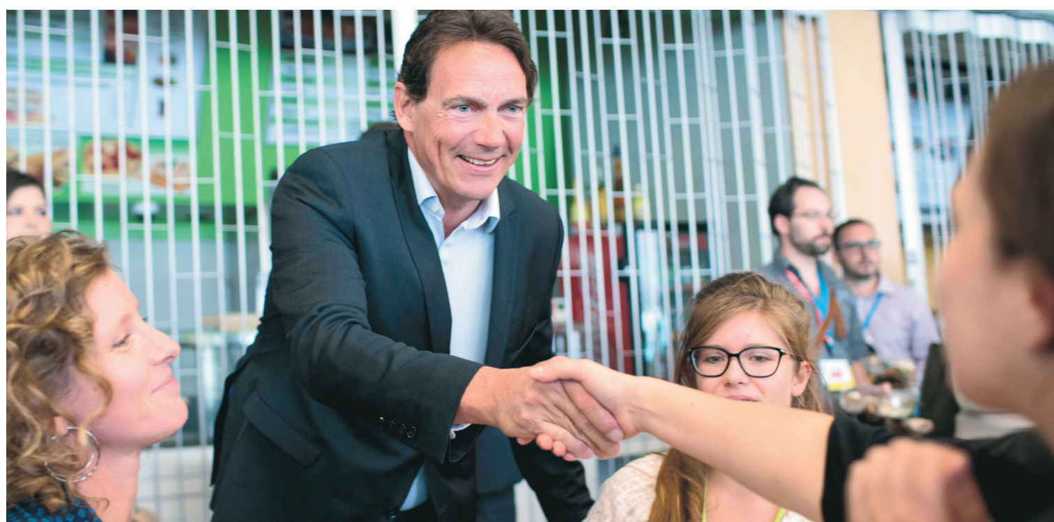
Deux jours avant son mariage avec Julie Snyder, samedi, Pierre Karl Péladeau était de passage à l'École d'été de l'Institut du Nouveau Monde. Le chef péquiste a admis qu'à Québec, son union est « the talk of the town ».