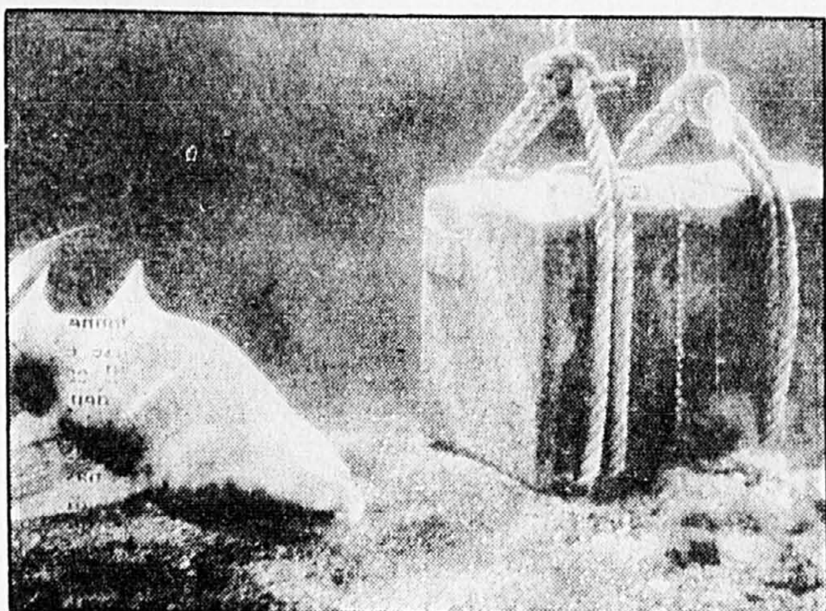
Un requin inspecte le coffre-fort de l'Andrea Doria, placé dans l'un des bassins de l'Aquarium de Coney Island en 1981, après sa récupération des entrailles du luxueux paquebot italien, qui sombra en 1956.