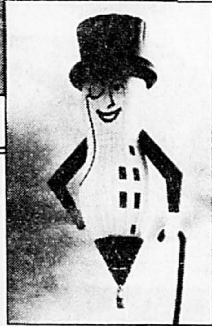
MONTGOLFIÈRES MONSIEUR PEANUT, LA TÊTE DANS LES NUAGES