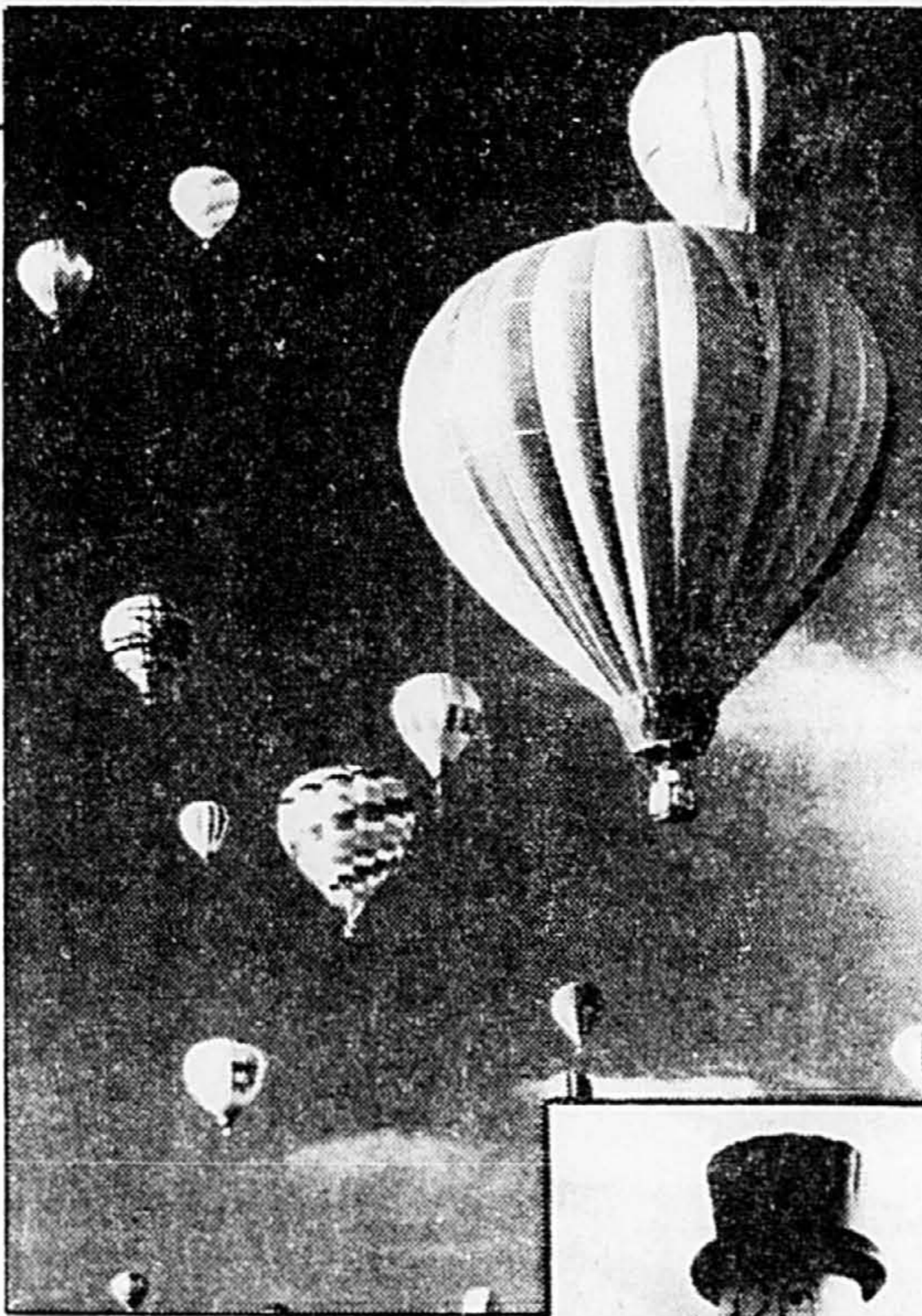
L'envolée des montgolfières, moment grandiose d'un Festival. On reste bouche-bée devant pareil spectacle...