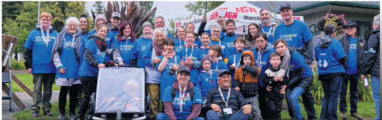
La région espère amasser 45 000 $ pour aider les gens avec des maladies rénales.