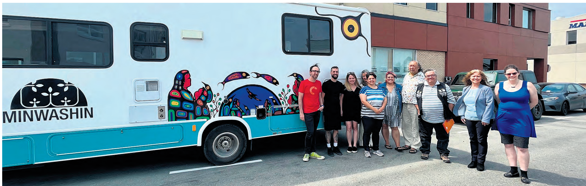
L'équipe de Minwashin et partenaires, devant le tout nouveau studio de numérisation nomade décoré par un artiste anicinabek.