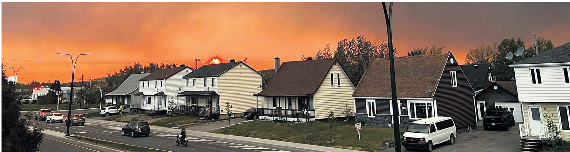
Chibougamau a ordonné l'évacuation de tous ses citoyens le mardi 6 juin en soirée. Près de 7 500 personnes ont pris la route vers Roberval située 250 kilomètres plus loin.