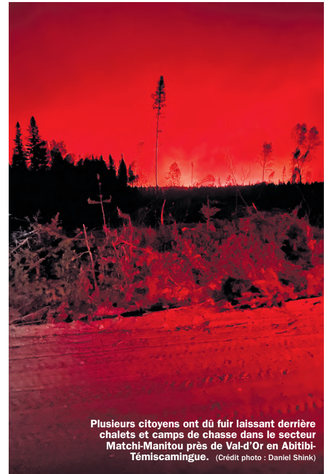
Plusieurs citoyens ont dû fuir laissant derrière chalets et camps de chasse dans le secteur Matchi-Manitou près de Val-d'Or en Abitibi-Témiscamingue.