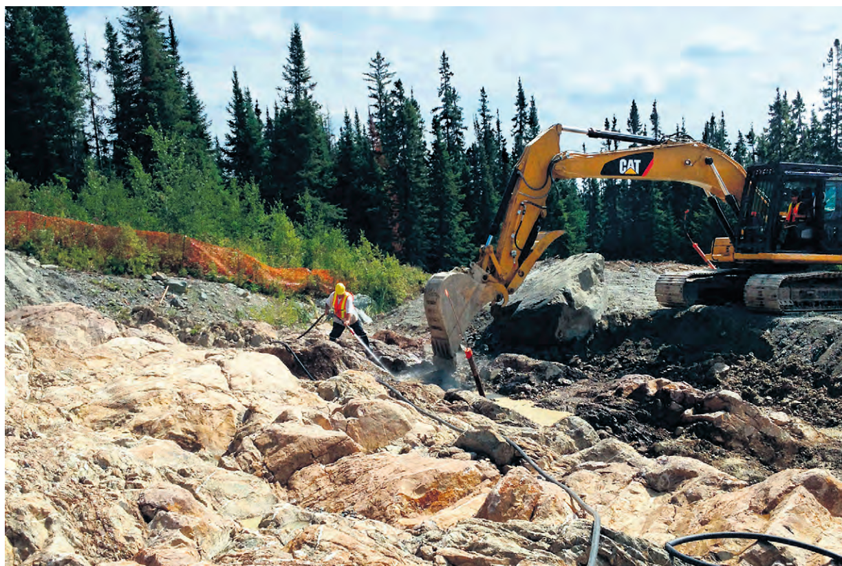
Les travaux d'exploitation au site Fayolle, propriété d'IAMGOLD, ont débuté dernièrement.

Ces chiffres ont été avancés en 2019 dans un rapport sur l'estimation des ressources minérales du site, un rapport rédigé à l'époque par la compagnie Monarch.