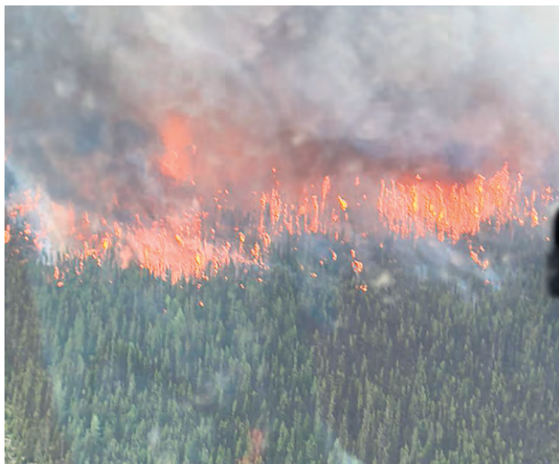
Un impressionnant brasier s'est approché de Lebel-sur-Quévillon forçant l'évacuation de celle-ci le vendredi 2 juin.

Évacuation de plusieurs communautés menacées par les flammes - L'une des pires semaines depuis des décennies en ce qui concerne les feux de forêt a chamboulé la vie de milliers de citoyens de l'Abitibi-Témiscamingue et du Nord-du-Québec