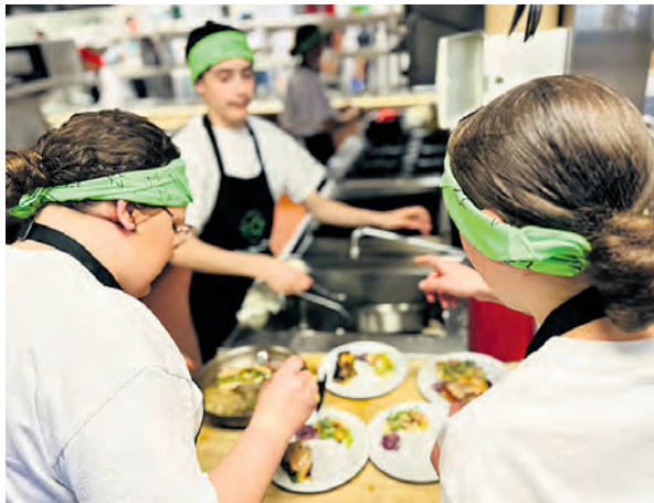
Alors que les membres de la brigade dressaient le plat avant de le présenter aux juges.