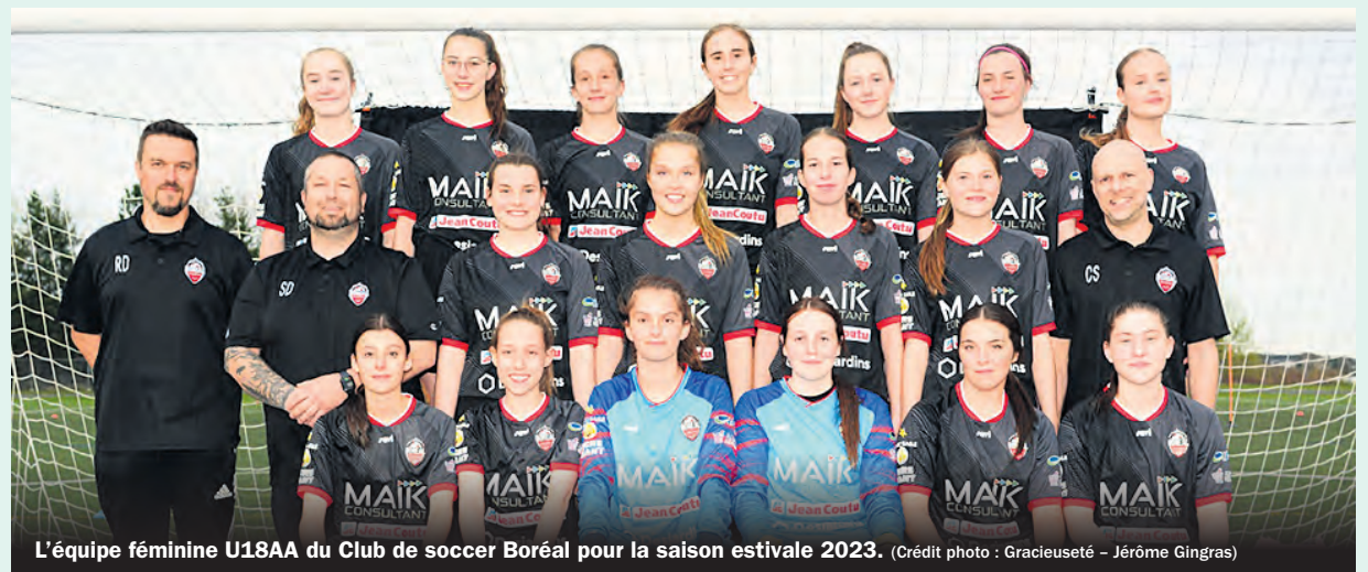
L'équipe féminine U18AA du Club de soccer Boréal pour la saison estivale 2023.