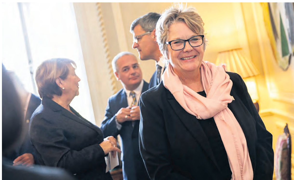
Québec a allongé 700 000 $ en Abitibi-Témiscamingue pour prolonger d'un an sa politique de lutte à la pauvreté.

Claire Bolduc espère que les consultations menées par la ministre Rouleau déboucheront sur une façon de faire différente cette fois. « Chaque fois qu'on veut amender la politique de lutte à la pauvreté et à l'exclusion sociale, il