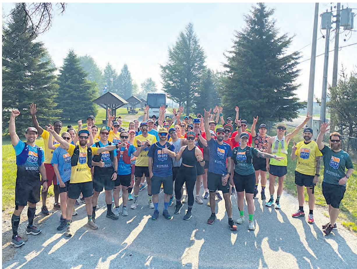
Les athlètes se faisaient une joie de courir pour la bonne cause, comme ici à la sortie de Cadillac plus tôt dans la journée.

Une somme record - En raison de la dégradation de la qualité de l'air liée aux feux de forêt qui sévissent dans la région, les athlètes du Défi lamgold sont contraints de stopper leur progression.