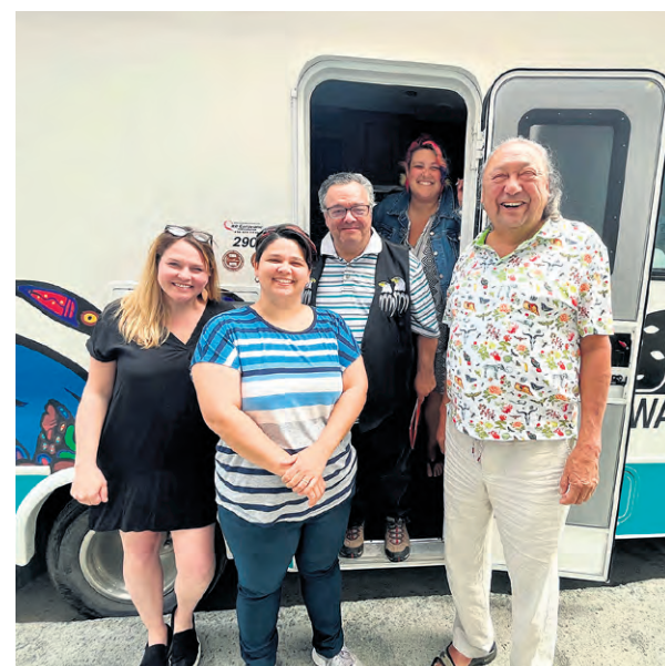
L'équipe de Minwashin prendra la route à la rencontre de plusieurs communautés anicinabek, afin d'entreprendre une campagne de numérisation des archives.

« C'est important que les documents d'archives qui concernent l'histoire des Anicinabek soient accessibles aux gens. Que ces documents soient classifiés dans un