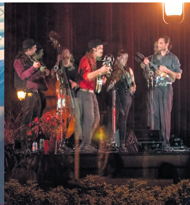
Balbuzard Pêcheurs et Picky Pickers seront les deux premiers groupes musicaux présentés par le GRAAT.