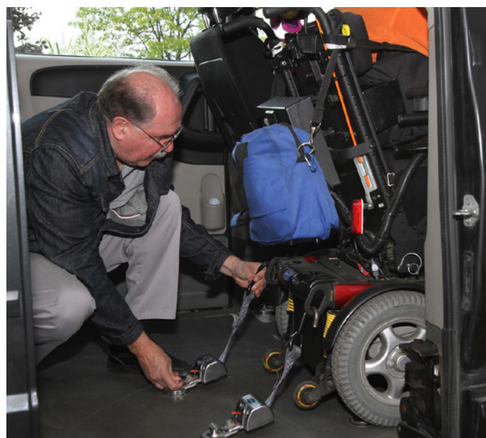
Les ancrages devant la banquette arrière sont présents pour vous permettre de respecter les angles de vos quatre sangles d'ancrages lorsque vous avez un fauteuil plus long.

Afin de garantir un transport sécuritaire aux clients du transport adapté, en tout temps, les fauteuils doivent être fixés aux quatre points d'ancrage (deux devant et deux derrière).