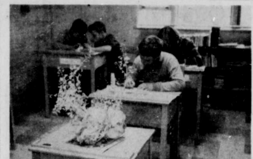
Aspect. — Voici l'aspect que présente la plante en gros plan. On peut remarquer les tiges et les fleurs provenant de ce chou. A l'arrière-plan, un groupe d'écoliers vaquent à divers travaux.