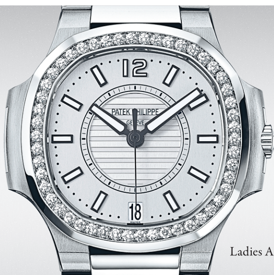
Ladies Automatic Nautilus Réf. 7008/1A