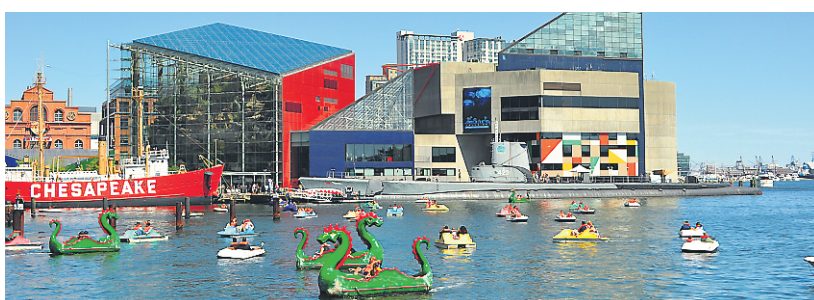
L'Aquarium national de Baltimore

Hôtel Four Seasons Baltimore, États-Unis, fourseasons.com