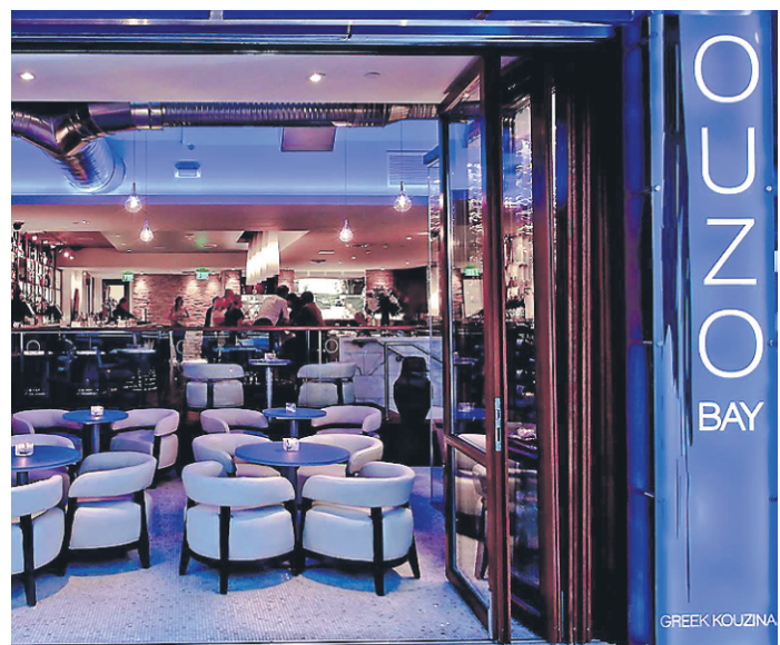
Le restaurant Ouzo Bay