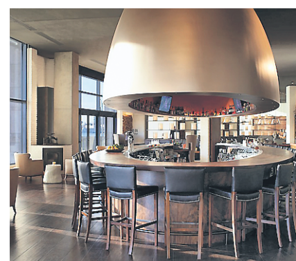
Le bar Wit and Wisdom