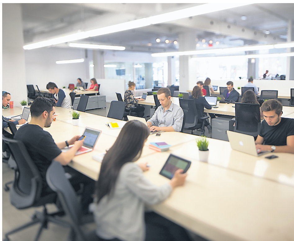
De jeunes entrepreneurs trouvent un bureau, des conférences et des ateliers à l'espace de travail collaboratif La Gare.

La popularité croissante du quartier entraîne les loyers à la hausse. Le 1 er juin, l'arrondissement du Plateau-Mont-Royal a donc adopté une nouvelle politique pour favoriser le logement social sur son territoire. « À partir de cinq unités,