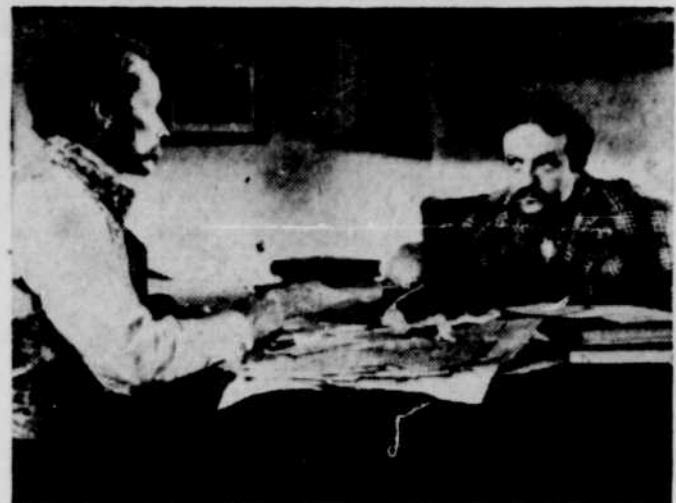
Jean-Louis Barrault et Bernard Blier dans un moment du film: D'HOMME A HOMME un des plus émouvants récits qui soient qu'obtient présentement au Cinéma de Paris, un très très succès.

Le plus extraordinaire des films au Cinéma de Paris