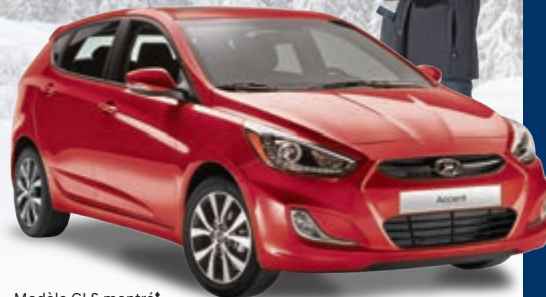
Modèle GLS montré*