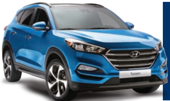
Modèle Ultimate montré*