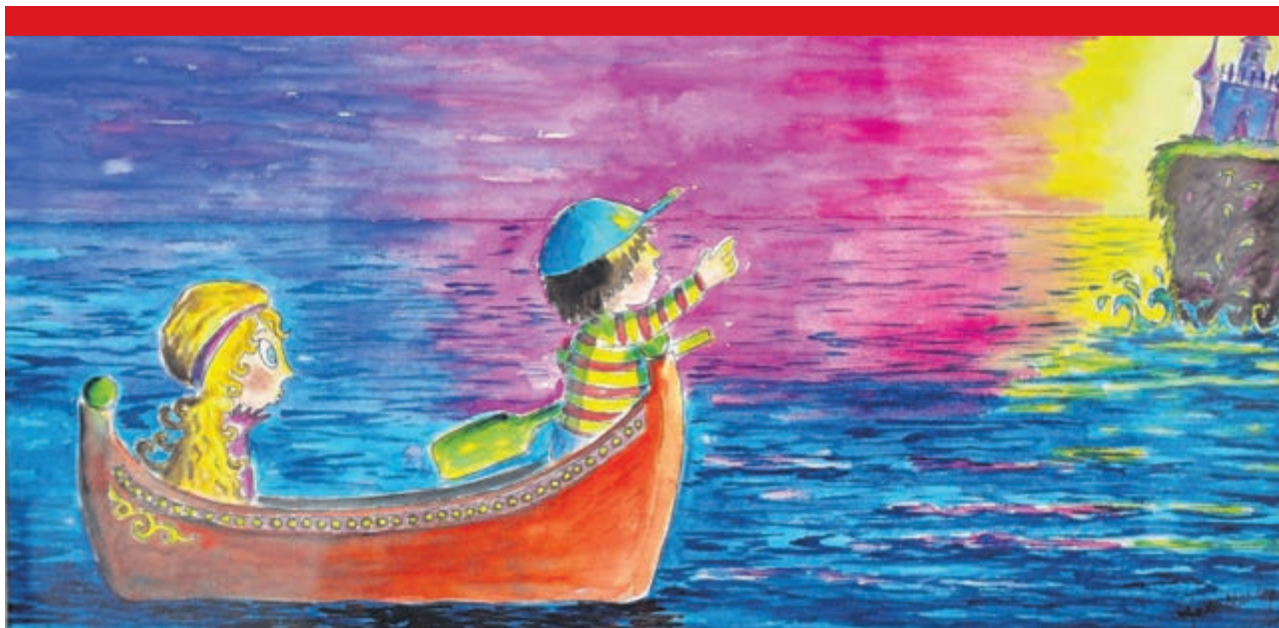
Voici un bel exemple de cette période naïve. La mer, de petits enfants dans un petit bateau et la côte (sans doute gaspésienne) à l'horizon.