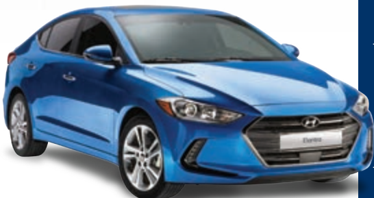
Modèle Limited montré*

0$ comptant | Prix au comptant : 14 131 $ Incluant 1 500 $ en ajustement de prix à l'achat avec financement 9 Frais de livraison et de destination inclus. Taxes en sus.