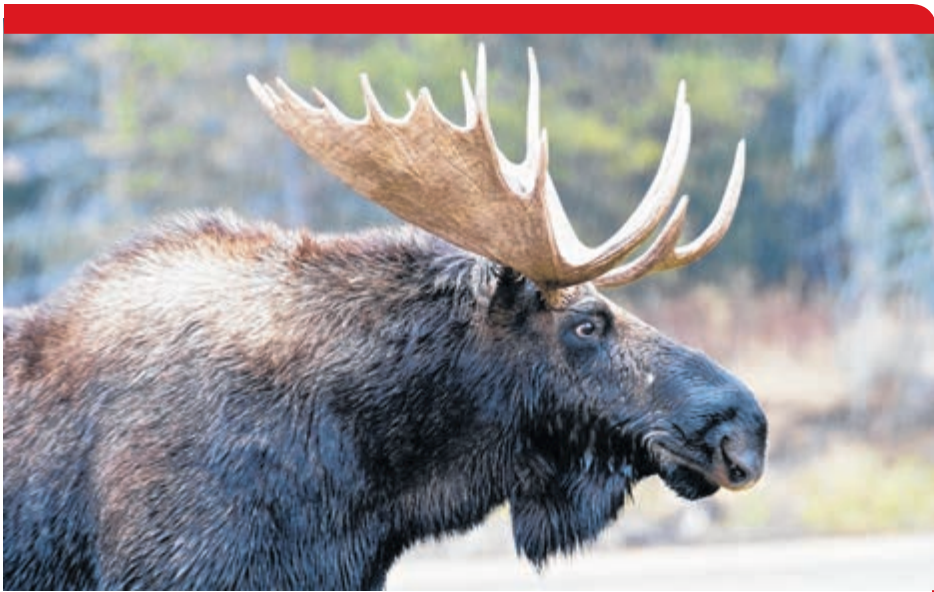
La chasse au roi de nos forêts a encore connu passablement de succès cette année.