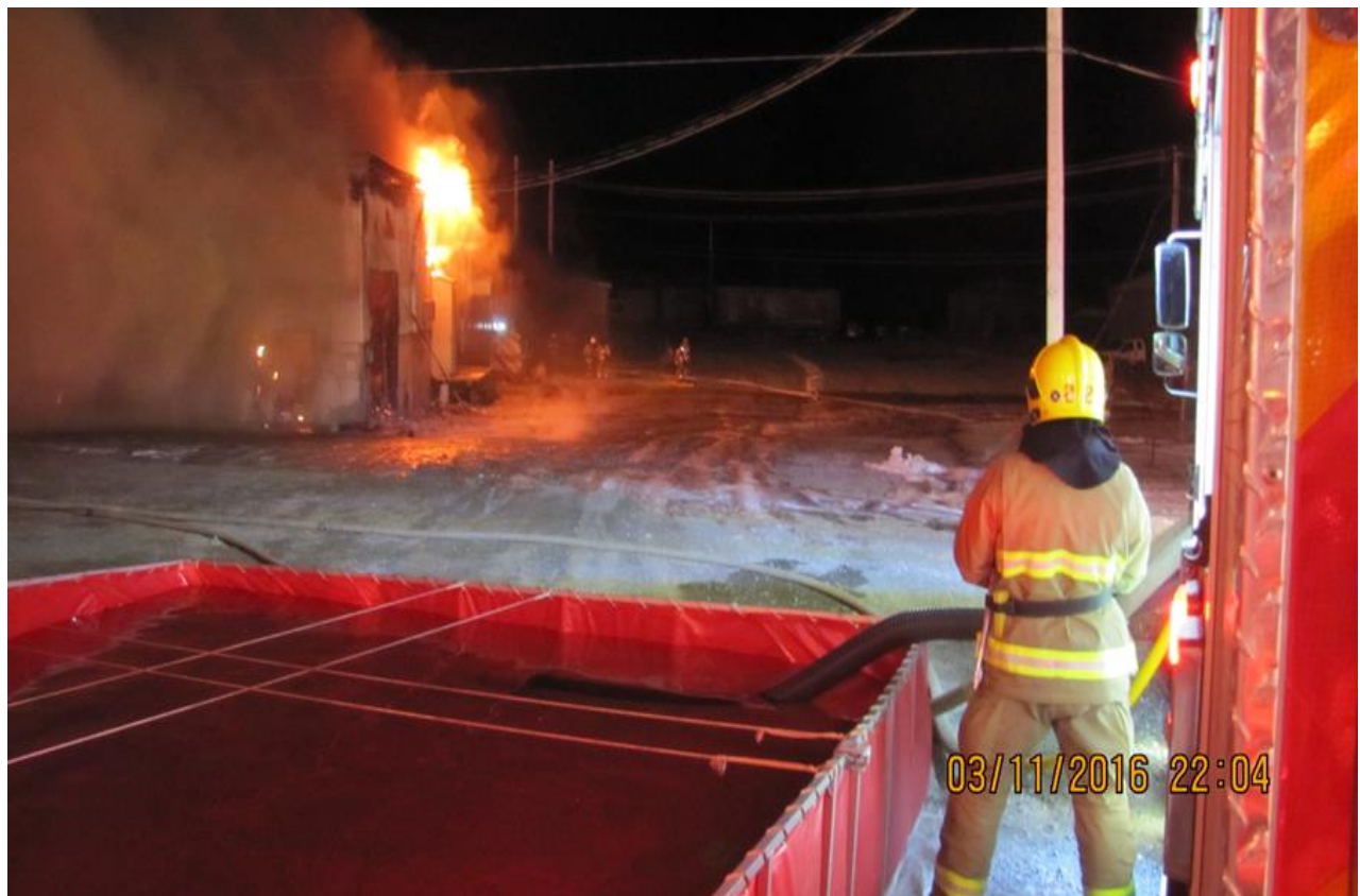
Intervention majeure à l'extérieur du territoire du réseau d'aqueduc