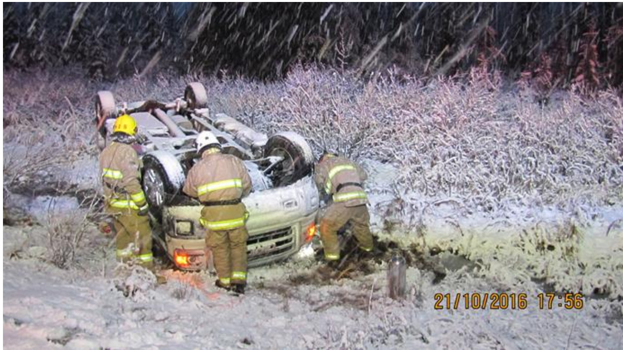
DÉSINCARCÉRATION km 249 Route 167