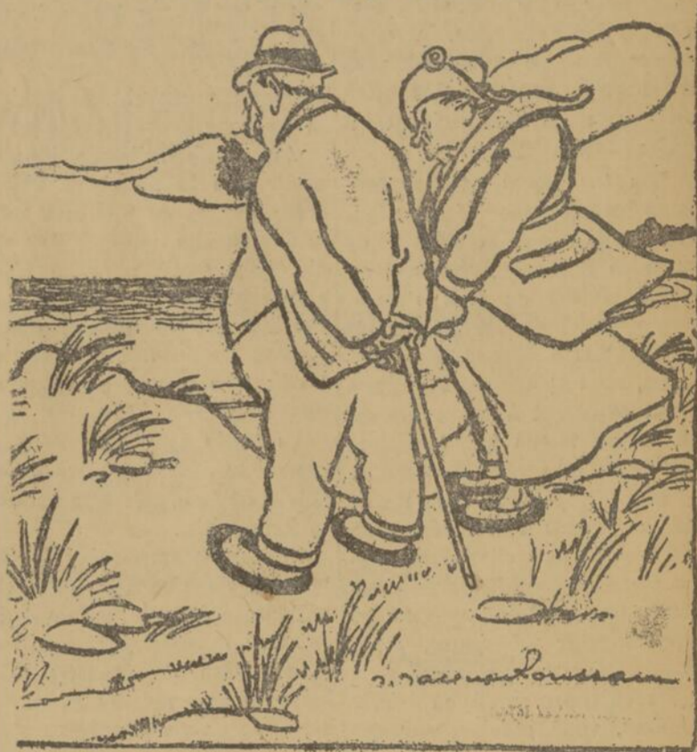
LE MONSIEUR PHILOSOPHE. — Elle est tellement plate! Est-ce qu'on dirait qu'il y a des montagnes de sel là-dedans.