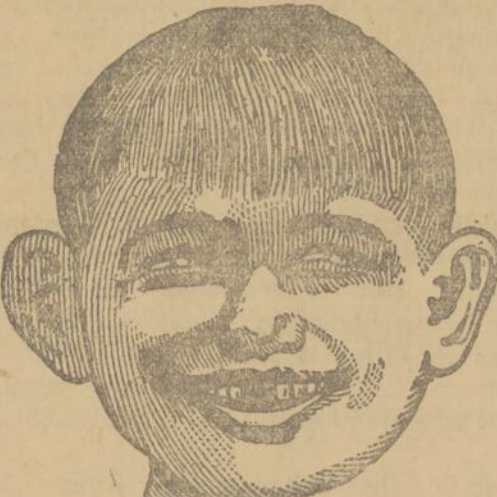
Sapristi, les dentistes de l'Institut Dentaire ne m'ont pas fait mal du tout... du tout.