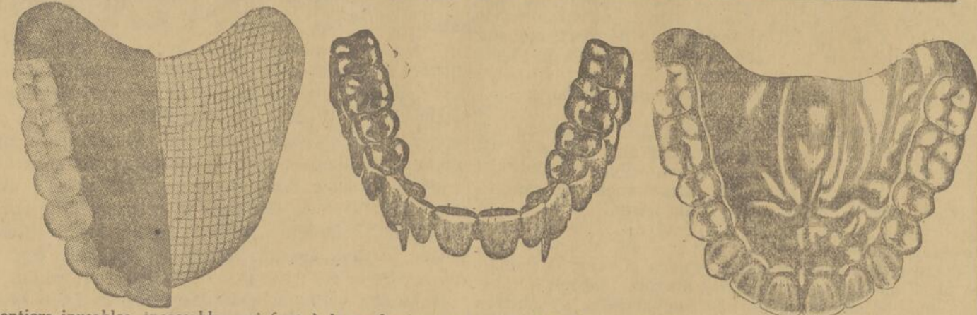
Dentiers inusables, incassables qui font à la perfection, qui s'adaptent à la perfection et avec lesquels vous pouvez manger et parler comme avec de vraies dents.