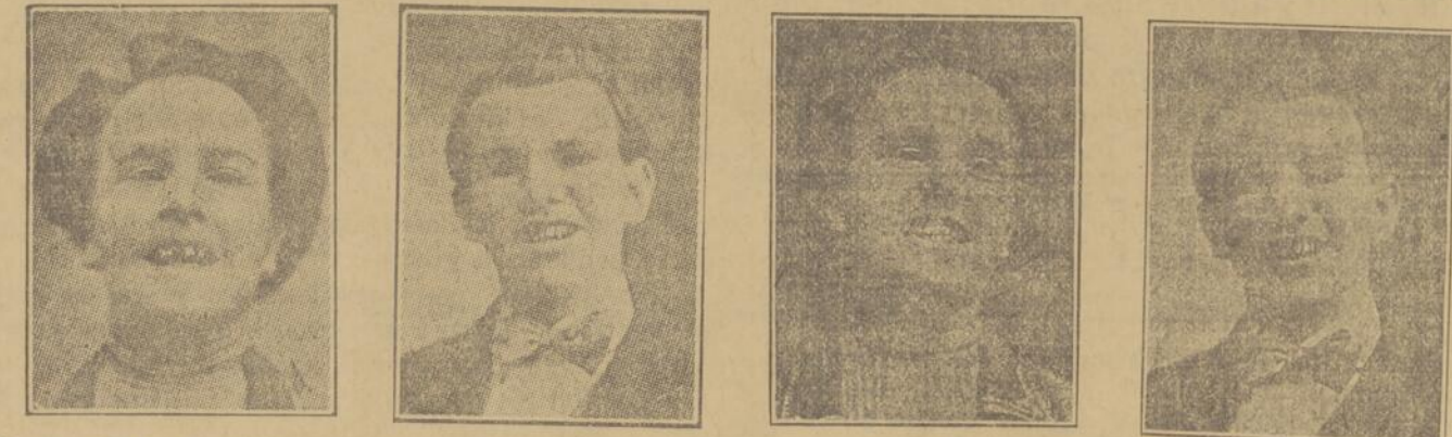
Remarquez ces jeunes personnes avec leurs mauvaises dents (à gauche) et remarquez leurs figures épanouies après qu'elles furent traitées, soignées, sauvées par le dentiste.

Trop de monde malheureusement ne connaît pas les bienfaits d'une parfaite dentition. L'HYGIENE DENTAIRE est de nécessité PRIMORDIALE . Les mauvaises dents sont la cause d'une foule de maux. On a découvert dans les mauvaises dents les microbes de la fièvre typhoïde, de la tuberculose et de la PARALYSIE INFANTILE . TRENTE-DEUX BONNES DENTS, CE SONT TRENTE-DEUX MEDECINS QUI VOUS SOIGNENT. Si vous voulez avoir une BONNE DIGESTION , ayez de BONNES DENTS . L'ART DENTAIRE a fait des PROGRES CONSIDERABLES depuis vingt ans. AUJOURD'HUI , on pose LES DENTS SANS PALAIS . AUJOURD'HUI , on extrait les dents sans douleurs. AUJOURD'HUI , on pose des dentiers qui remplacent à s'y tromper les dents naturelles. AUJOURD'HUI , il n'est plus nécessaire de se faire extraire les dents. ON LES TRAITE , on les soigne et on les guérit et cela SANS DOULEUR .