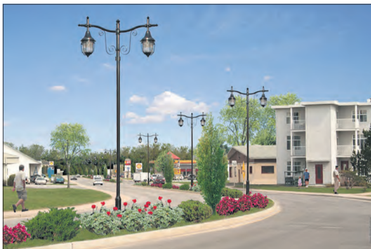
Ce photomontage donne une excellente idée de la transformation prochaine du boulevard Dollard.

Le boulevard Dollard est l'une des principales portes d'entrée de Joliette. Comme ce fut le cas