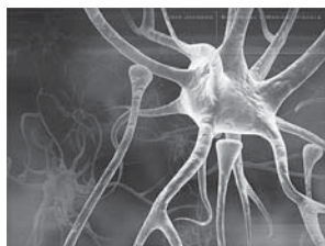
Laboratoire de psychophysiologie cognitive et sociale

Nous recherchons des volontaires entre 30 et 55 ans pour servir de groupe de comparaison dans le cadre d'une recherche scientifique, financée par les Institut de recherche en santé du Canada, visant l'étude du fonctionnement cérébral chez les personnes souffrant de trouble obsessionnel-compulsif (IRSC - Reasoning processes in obsessive-compulsive disorders).