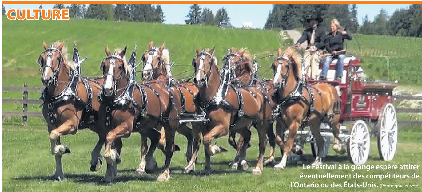
Le Festival à la grange espère attirer éventuellement des compétiteurs de l'Ontario ou des États-Unis.