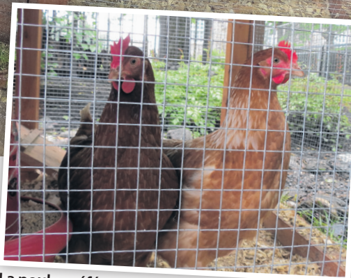
La poule préférée de Léda Fontaine est Blandine.