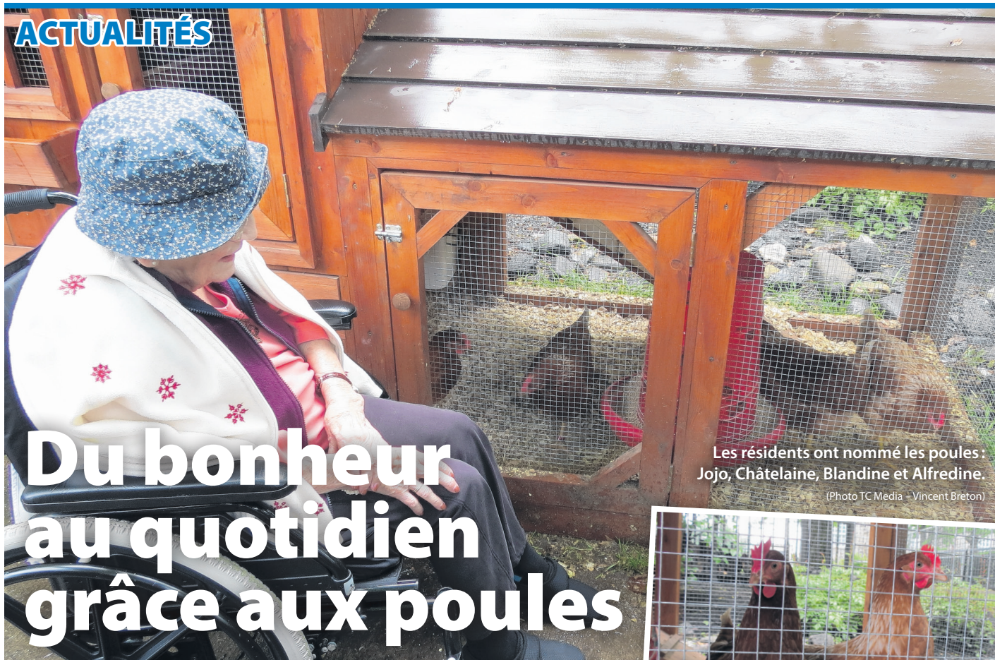
Les résidents ont nommé les poules : Jojo, Châtelaine, Blandine et Alfredine.