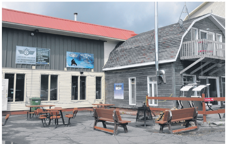
Le bâtiment hébergeant l'ancien théâtre de la base militaire accueille aujourd'hui les visiteurs du Domaine du Radar.