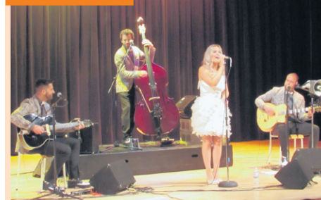
La formation de jazz manouche en a surpris plus d'un.

L'organisateur s'attend par ailleurs à attirer entre 2000 et 3000 amateurs de chevaux et d'attelages. En tout, entre 75 et 80 chevaux défilent sur le manège installé pour l'occasion sur le rang Saint-David. Les compétitions de grandes bêtes alternent avec des concours de poney Welsh et de chevaux miniatures. Des spectacles auront aussi lieu en soirée dans la grange.