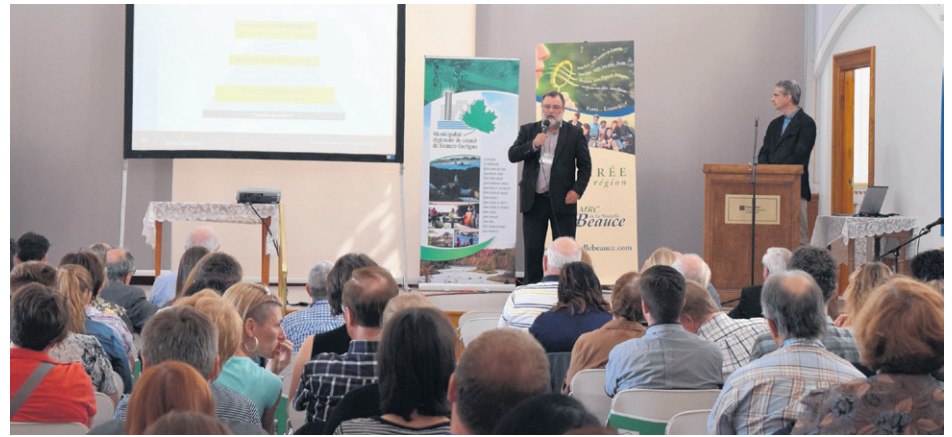
La plus récente Journée régionale de la Chaudière-Appalaches a réuni près de 200 personnes.

Le comité organisateur doit se réunir d'ici quelques jours pour tracer un bilan de l'activité. Les participants se sont généralement dits surpris du contenu livré lors de la journée qui reviendra assurément d'ici deux à trois ans pour une 5 e édition. Arrêter d'avoir des œillères, stopper les guerres de clocher, cesser de voir les villes comme des compétitrices et plutôt collaborer avec elles et celles-ci utilisent davantage les milieux ruraux qui les entourent sont quelques-uns des éléments ayant été partagés par les conférenciers au cours de la journée.