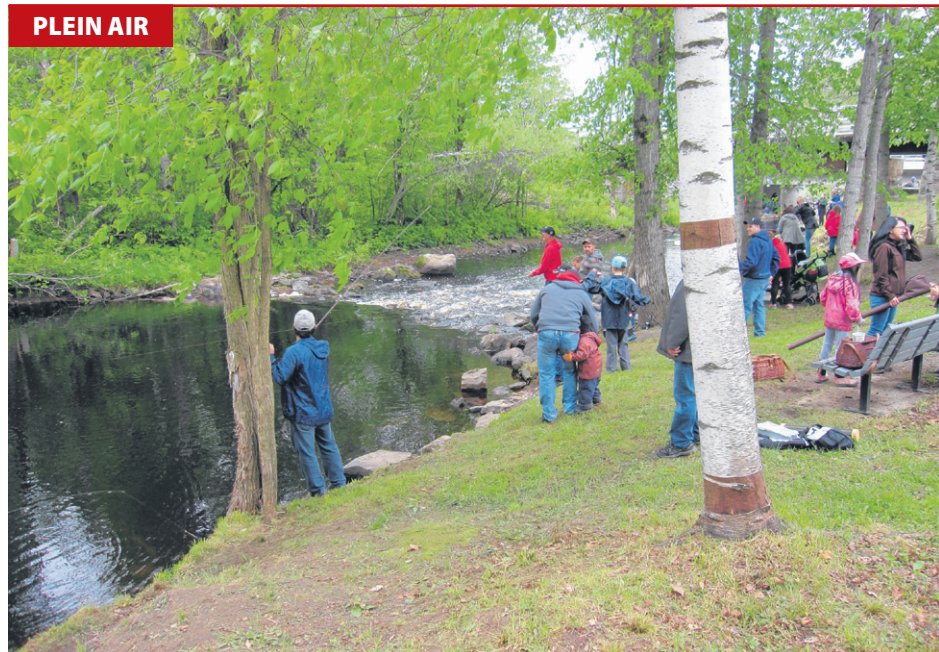
La Fête de la pêche se tient à Dosquet depuis 2013.