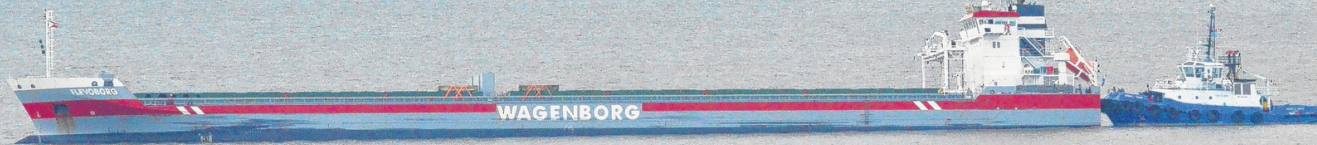
Le navire Flevoborg devant Sainte-Croix.