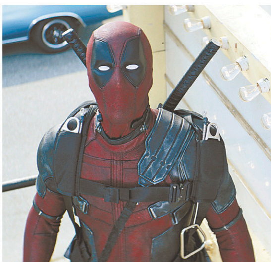
Ryan Reynolds en Deadpool ne recule devant rien pour faire rire (et y parvient systématiquement).