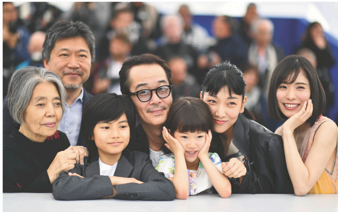
À partir de la gauche, l'actrice Kirin Kiki et le réalisateur Hirokazu Kore-Eda aux côtés des comédiennes Jyo Kairi, Lily Franky, Miyu Sasaki, Sakura Ando et Mayu Matsuoka, lundi, à Cannes.