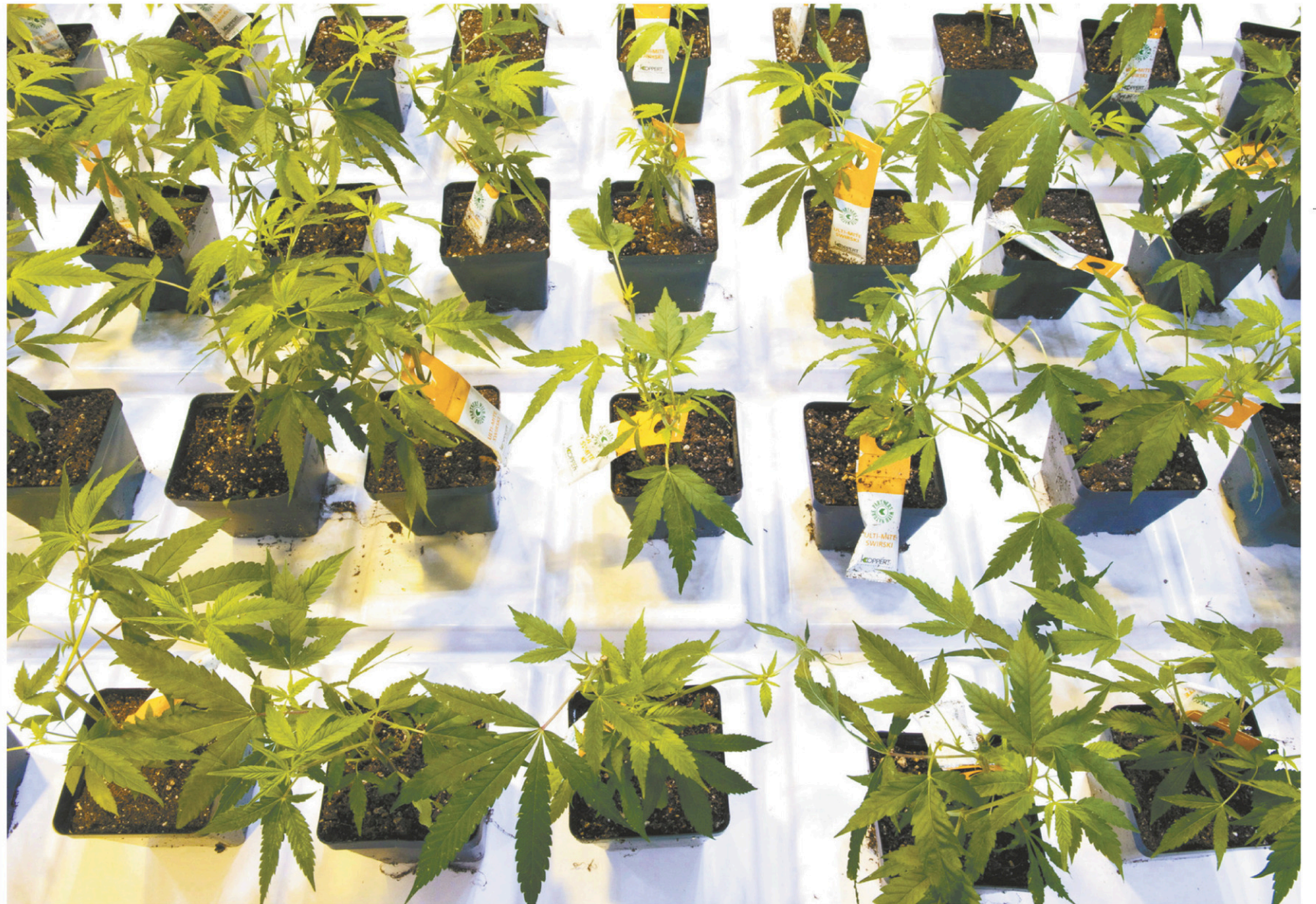
Aurora Cannabis a annoncé lundi matin l'acquisition de MedReleaf pour 3,2 milliards en actions, l'objectif étant de renforcer leur développement sur le marché international.