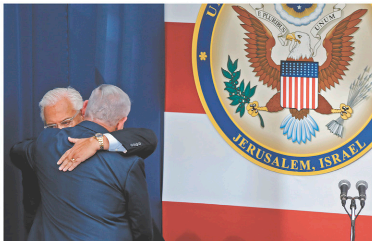
L'ambassadeur américain en Israël, David Friedman, et le premier ministre israélien, Benjamin Netanyahu, se sont donné l'accolade sur scène, dimanche, à Jérusalem.

De source officielle à Washington, on laisse entendre que le plan est quasi achevé et pourrait être bientôt présenté aux deux camps. Il y a quelques jours, le premier ministre israélien assurait n'avoir « pas vu » ce projet américain. Compte tenu de l'alignement de Donald Trump sur Nétanyahou