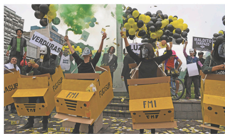
EITAN ABRAMOVITCH AGENCE FRANCE-PRESSE

Le Fonds monétaire international (FMI), appelé à la rescousse par Buenos Aires le 8 mai, examinera vendredi la demande d'aide formulée la semaine dernière, a annoncé lundi