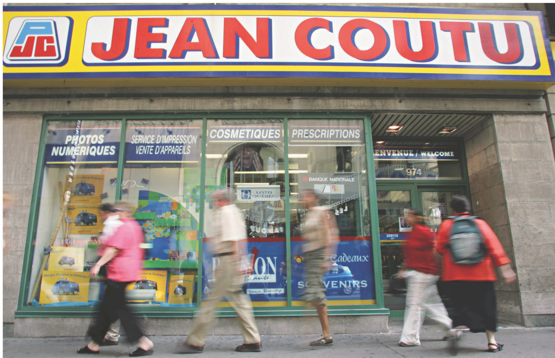
La transaction de 4,5 milliards annoncée en octobre a été confirmée vendredi dernier.