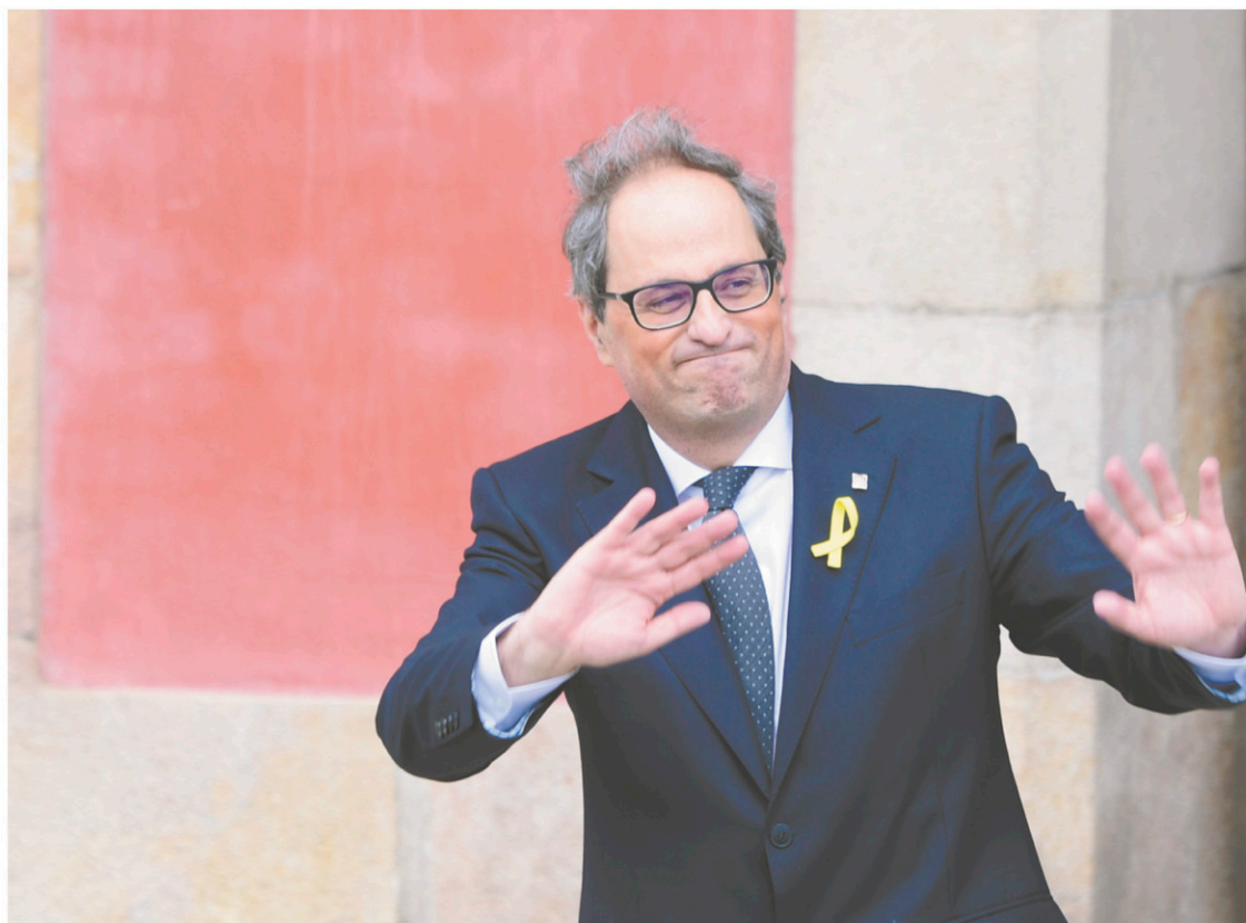
Le nouveau président catalan, alors qu'il quitte le parlement après son élection, lundi, à Barcelone