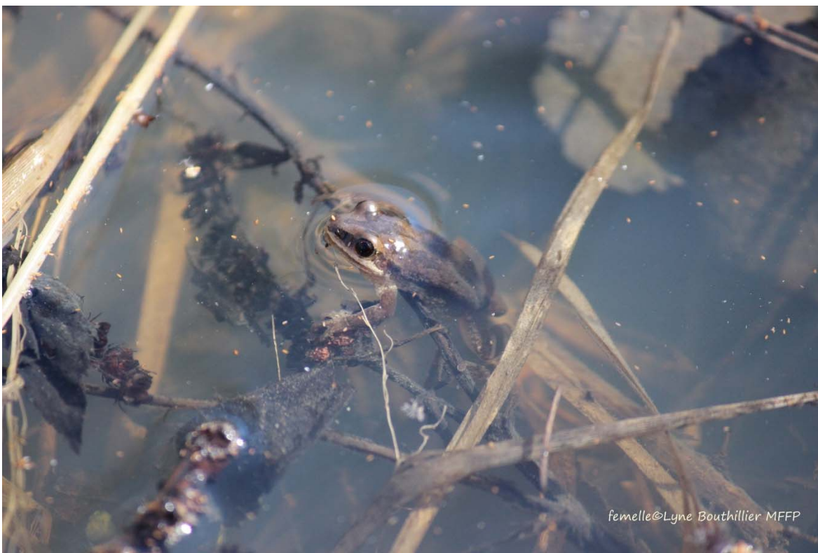
Figure 1. Rainette faux-grillon

La rainette faux-grillon est un amphibien de la famille des Hylidés, dont la taille atteint de 1,9 à 3,9 cm (Dodd, 2013). Sa peau, légèrement granuleuse, varie du beige au brun foncé et est quelquefois vert terne, olive ou rougeâtre (Rodrigue et Desroches, 2018). Cette espèce présente une pigmentation variable selon le moment de la journée et les individus sont plus foncés pendant le jour et quand il fait froid, alors que leur pigmentation est plus claire pendant la nuit ou lorsqu'il fait chaud. Ses doigts, relativement longs, sont munis de disques adhérents peu développés qui en font une moins bonne grimpeuse que la rainette versicolore ( Hyla versicolor ) (Dodd, 2013). On la reconnaît à ses trois rayures dorsales foncées, pouvant également être constituées d'une succession de points, et à la bande latérale noirâtre qui parcourt ses flancs du museau jusqu'à l'aîne, en traversant l'œil. Aussi, la lèvre supérieure est blanchâtre (figure 1). Son chant est caractéristique : il s'agit d'un long crissement sec et ascendant, semblable au bruit que fait un ongle en passant sur les dents d'un peigne en métal, et qui se répète à intervalles réguliers (Bonin et Galois, 1996; Harding, 1997; Rodrigue et Desroches, 2018).