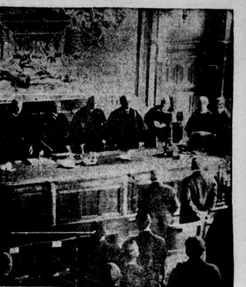
Première séance de la Cour Internationale de Justice, le 15 juin dans le Palais de la Paix à La Haye