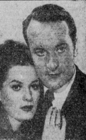
Jeanette MacDonald, la célèbre cantatrice que l'on peut voir d'aujourd'hui à vendredi dans la production en couleurs naturelles "Smilin' Through" avec une autre grosse attraction.