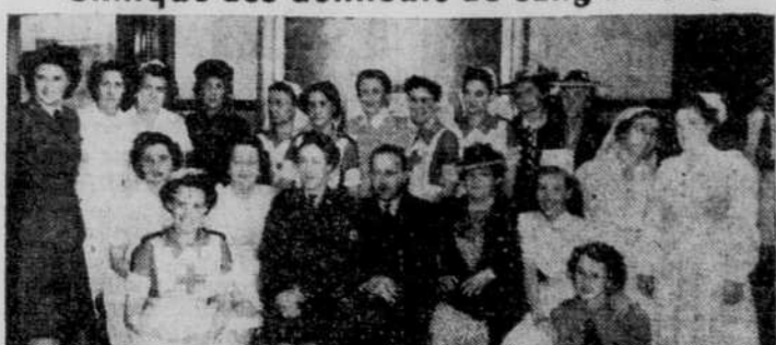
Ces photographies ont été prises à la Clinique des donneurs de sang à l'Hôtel-Dieu de Lévis. En haut, on aperçoit le personnel de la clinique.