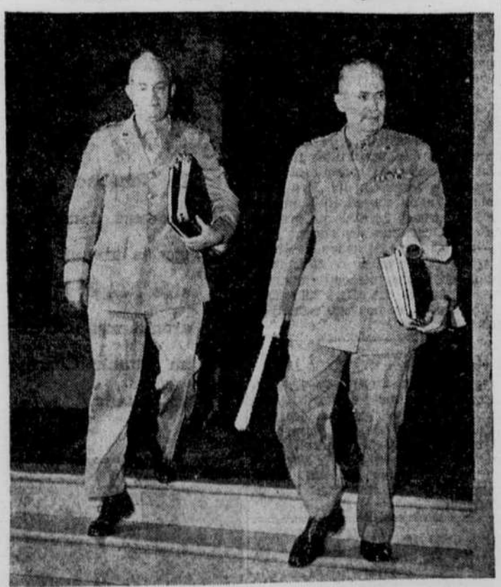
Les débats de la conférence CHURCHILL-ROOSEVELT, relevant de l'état-major des trois pays participants, se sont poursuivis sans interruption au Château Frontenac. On voit ici le général H. H. ARNOLD, chef de l'aviation américaine, à gauche, et le général BREHON B. SOMMERVELL, chef des troupes d'approvisionnement pour l'armée américaine, quittant la chambre des débats. On remarque qu'ils portent cartes et documents avec eux.