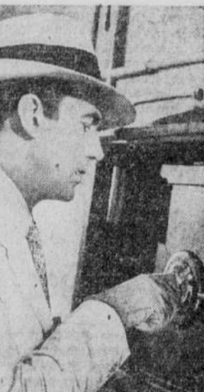
Walter Pidgeon, le premier rôle de "Phantom Raiders", un des grands films du programme qui commence aujourd'hui à ce théâtre.