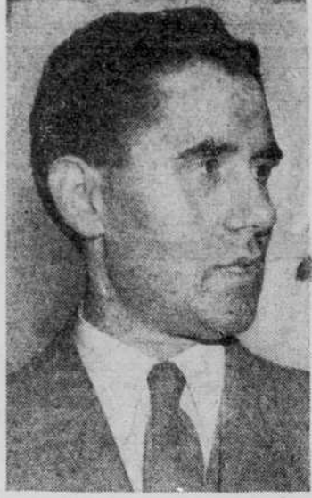
ANDREI-A. GROMYKO est le nouvel ambassadeur de Russie aux Etats-Unis. Il succède à Maxim Litvinov qui a été rappelé à Moscou.