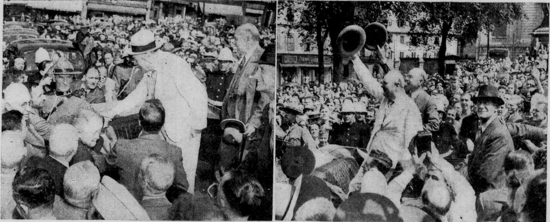
La population de Québec accueille avec enthousiasme Winston Churchill

Le bulletin révèle aussi que des unités navales légères, probablement des contre-torpilleurs, se sont aventurés hier soir jusqu'à 70 milles au nord de Salamaua, dans la partie la plus étroite du détroit de Dampier, pour canonner de près le