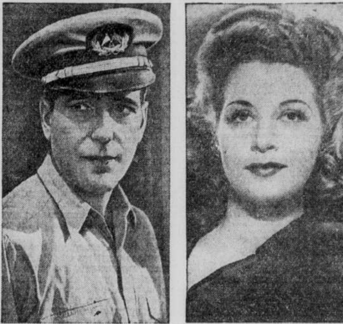
Humphrey Bogart et Julie Bishop, vedettes de "Action in the North Atlantic", d'aujourd'hui à jeudi. Alan Hale et Raymond Massey ont aussi des rôles de premier plan dans ce film.