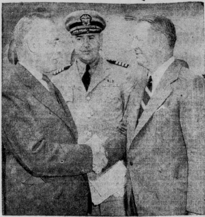
Le colonel FRANK KNOX, secrétaire de la marine des Etats-Unis, est arrivé à Québec hier midi, par avion, pour participer à la conférence CHURCHILL-ROOSEVELT. On voit, à gauche, l'honorable LOUIS ST-LAURENT, ministre de la Justice du Canada, souhaitant la bienvenue au ministre américain. Au centre le capitaine LELAND LOVETT, chef des relations de presse de la marine des Etats-Unis.