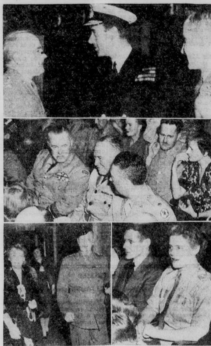
Ces quelques photos furent prises, hier soir, au théâtre Capitot, à l'occasion de la 1ère représentation de la pellicule cinématographique "This is the Army", réalisation de la compagnie Warner Brothers. Cette représentation fut offerte en l'honneur des distingués visiteurs rassemblés en notre ville depuis plus de deux semaines. On aperçoit sur la photo du haut, le brigadier EDMOND BLAIS, M.C., accueillant LORD LOUIS MOUNTBATTEN, chef des commandos, celle du centre nous fait voir le vice-maréchal de l'air C. BREADNER. Au bas, on aperçoit LADY F'NET accompagnée du lieutenant-colonel PAPINEAU, et à l'extrême droite, mademoiselle MARY CHURCHILL.