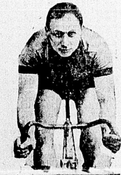
Pete Moeskops sera une des étoiles prenant part à la course de six jours sur bicyclette, qui est commencée hier à Madison Square Garden New-York. Une bourse record de $10,000 sera décernée au vainqueur.

Il y a des Centaines de coupons sous le liège, Cherchez-les; cela en vaut la peine.