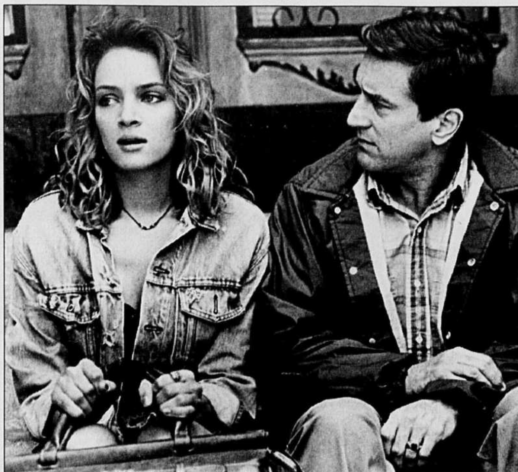
Wayne Dobie, alias «Mad Dog» (Robert De Niro) tombera amoureux de Glory (Uma Thurman), ce qui mettra sa vie en péril.