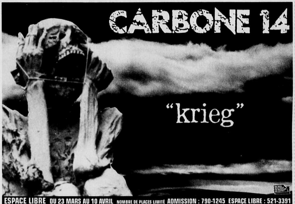
ESPACE LIBRE DU 23 MARS AU 10 AVRIL. NOMBRE DE PLACES LIMITÉ. ADMISSION: 790-1245. ESPACE LIBRE: 521-3391

Du Tallulah au New Orleans (rue St-Laurent!), où les Co-Locs lançaient mardi dernier un premier album, les étapes, sans être brûlées, ont été franchies rapidement. L'industrie a pris conscience de leur existence quand ils ont créé l'évène-