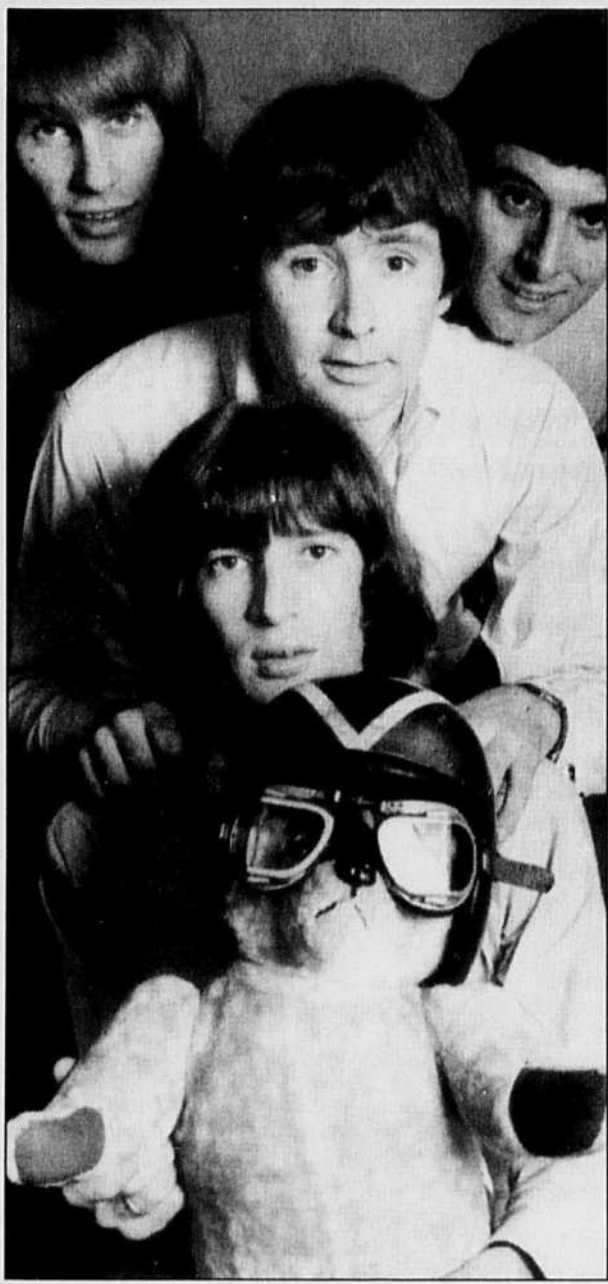
Les Troggs, mettant en vedette Chris Britton, Reg Presley, Peter Staples et Ronnie Bond.