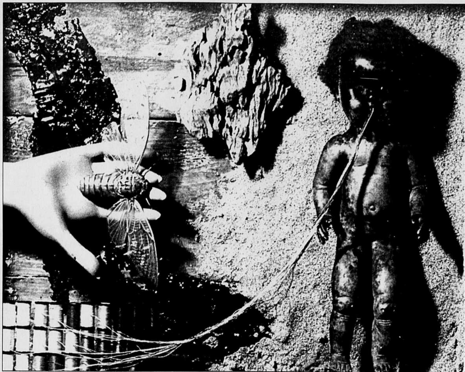
Le décor rocambolesque de Les mots de passe .