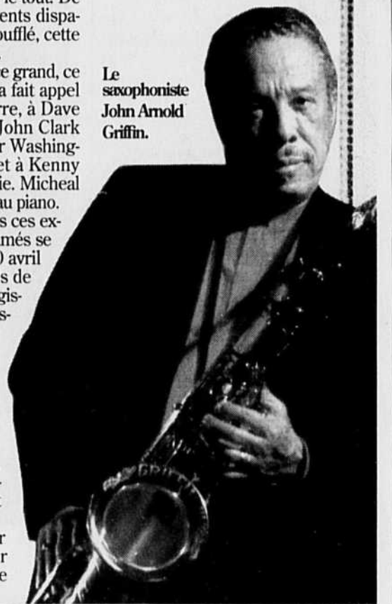
Le saxophoniste John Arnold Griffin.