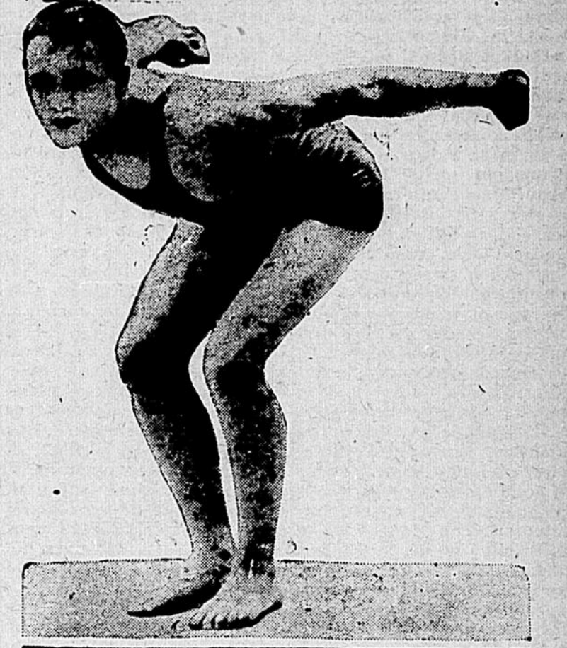
CAPT. RALPH BREWER

Le capitaine Ralph Brewer, de la Northwestern University, qui a gagné les épreuves de 40 et de 100 verges et qui a établi des records en même temps dans les deux cas. Son temps a été de 0.18 2-5 pour 40 verges et de 0.53 4-5 pour 100 verges "free style". L'ancien record était de 0.19, établi par Brewer lui-même en 1923, et de 0.55 4-5 établi par Howell en 1922.