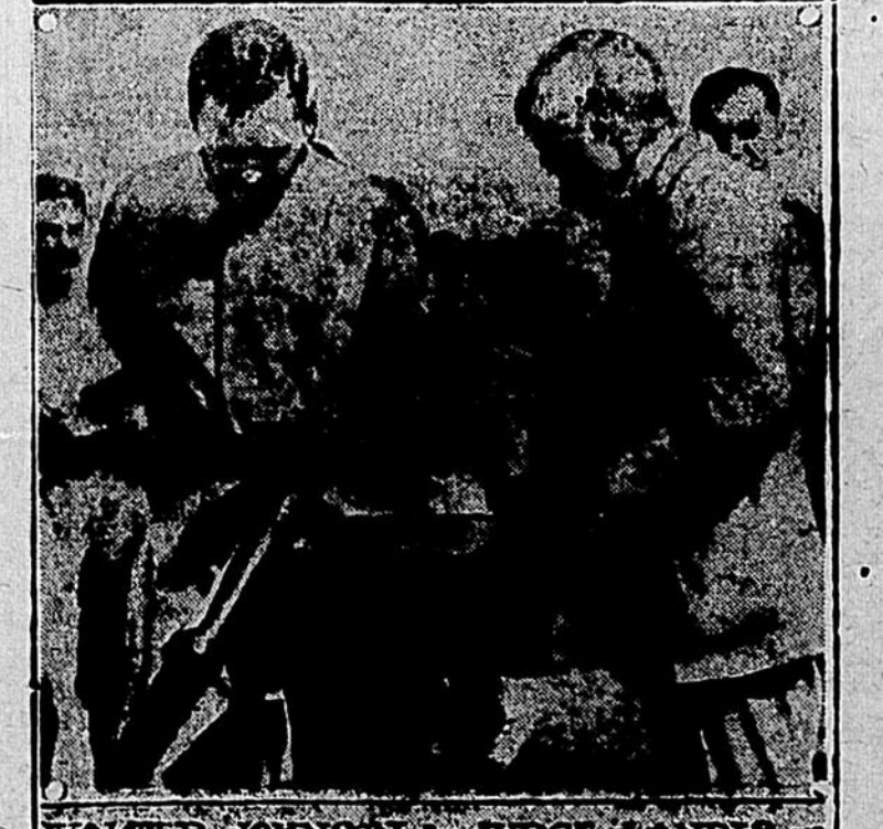
WALTER JOHNSON ET JUDGE ANDERSON Walter Johnson, le fameux lanceur qui a tant contribué à faire gagner le championnat mondial au club Washington l'an dernier, et le juge Landis, le haut commissaire du baseball, sont deux figures bien connues en Amérique. On les voit ici photographiés au terrain d'entraînement du club Washington à Tampa, Floride.