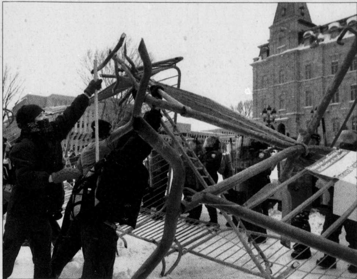
Des étudiants ont renversé une clôture de sécurité au cours d'une manifestation en faveur de la gratuité scolaire, hier, sur la colline parlementaire, à Québec.