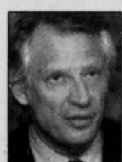
Dominique de Villepin

Des soldats de l'ONU en Haïti? La France a appelé hier la communauté internationale à envisager l'envoi d'une force de paix multinationale dans l'espoir d'y calmer la crise, alors que le président Jean-Bertrand Aristide, contre lequel la colère des Haïtiens continue de monter, rejetait à nouveau toute idée de démission, s'affichant comme le seul à pouvoir sauver le pays de la guerre civile.