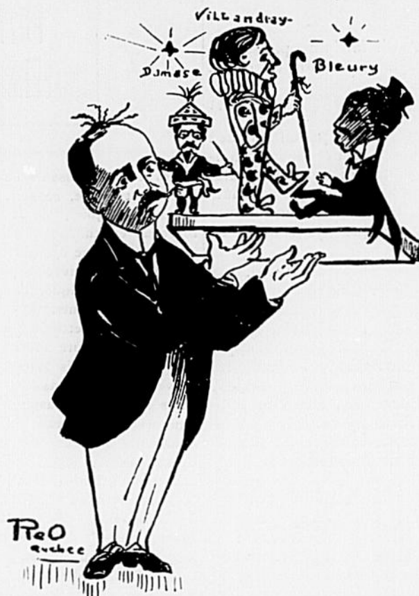
Le nouveau propriétaire du "Petit Québécois," tenant dans un plateau la destinée de sa famille.

active, dut se mettre de la partie et rétablir l'ordre. Pourtant, tous ceux qui l'ont vue s'accordent à le dire, la dame, comme toutes les autres, dormait les yeux fermés.